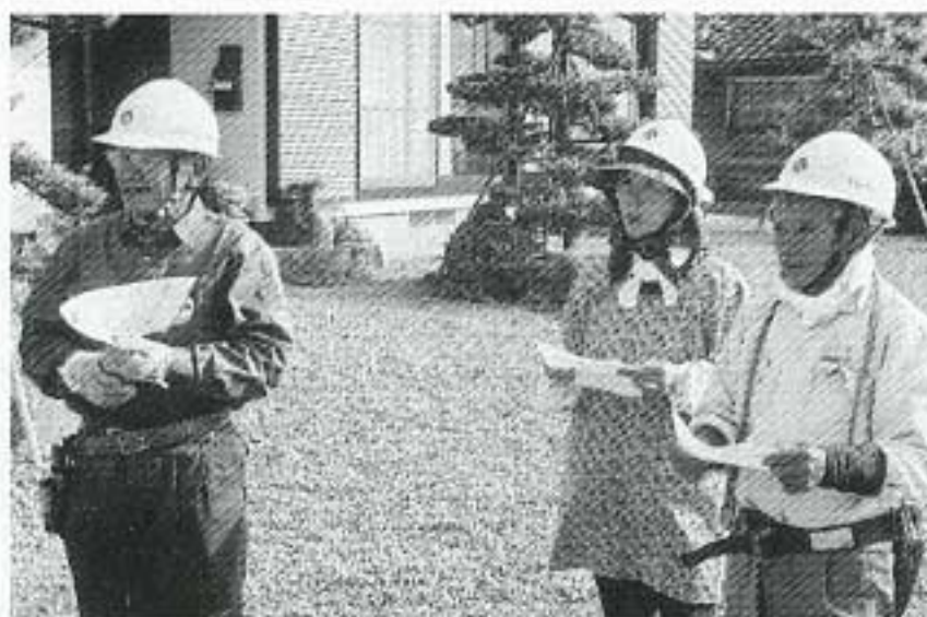
ミーティングしましたか?

11月25日(金)のパトロールは個人宅の剪定・除草、市道の除草・草刈・花植作業の就業先を巡回しました。