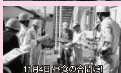
11月4日 昼食の合間に!