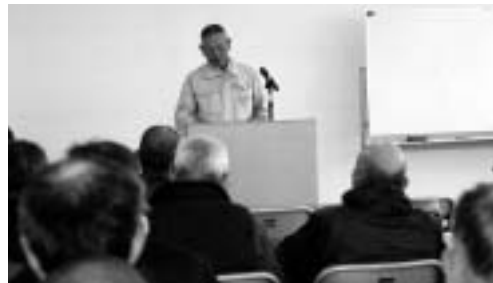
「喜ばれる仕事を安全に!」

4月15日 私が委員となって初めての剪定講習会は朝からあいにくの雨でしたが、シルバーワークプラザにて37名と多数の出席があり剪定班の皆様の安全面・技術面に対する強い気持ちを感じられました。剪定担当の委員として皆様の前で脚立の安全な設置法