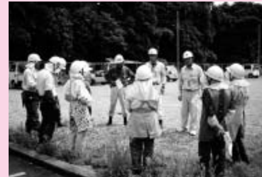
安全保護具着用の徹底を!