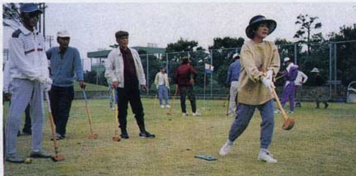
ホールインワンめざして、そおれ~!!

今年も残り一ヶ月、私がシルバー人材センターのお仕事を頂いて早や一年がきます。その間、旅行、運動会そして今回のランドゴルフ大会と何でもチャレンジして残りの人生を楽しく生きたいと思っています。一人です。このゴルフ大会にもすぐ申し込みました。何もかもが一年生ですが、チャレンジ精神だけは旺盛です。二、三回しかやった事はありませんでしたが、運が味方してくれたのかホールインワンを出して賞品まで頂きました。お世話して下さいました実行委員の方々には厚くお礼申し上げます。シルバー会員の皆様、ランドゴルフをやってみませんか、とても楽しいスポーツです。私はあるグループに入って二ヶ月目です。ホールインワンが時々出るようになりました。「センターへのお願い」 これからも色々な事を企画して楽しませて下さい。仕事も出来る限り参加してゆきます。又