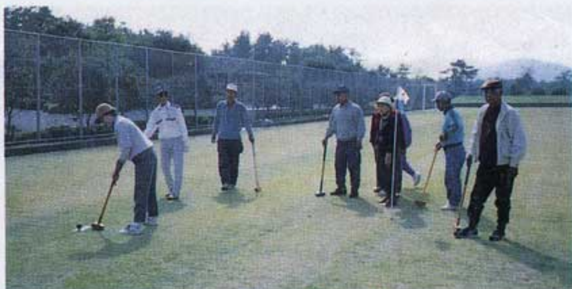
皆の視線を感じて「ドキドキ」