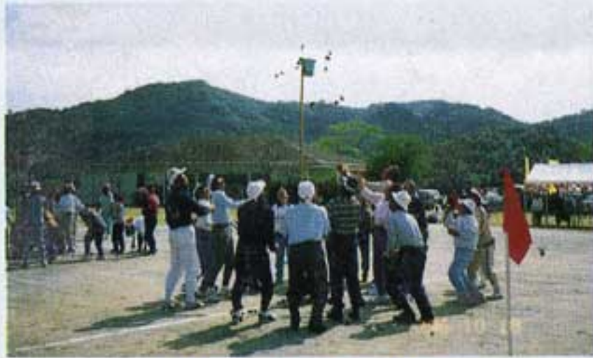
我を忘れて球入れに夢中

塩見農村公園に於いて、第三回会員運動会が曇天まさに運動会日和の下、熟年パワー全開して繰り広げられる。昨年は赤団の圧倒的勝利で白団を全く寄せつけなかったが、まあ今年も実力伯仲して各種目の競技終了を告げるピストルの音も聞こえない程の喚声をあげて一喜一憂応援にも熱がはいる。心配していた怪我人も無く笑いの終りを告げる。然し福利厚生委員による連携と親睦目的の運動会に今少しの参加者があってもとの声は大なり。