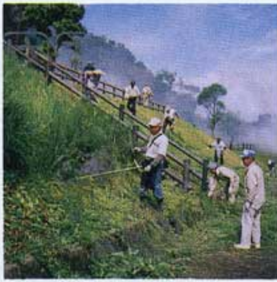
うまいと刈るもんじゃねえ～

十月九日(水) 夜来の雨もあがって清掃には最高なり。会を重ねて第七回目、今回は県内で委員の死亡事故もあり特別に安全委員長による事故防止の徹底を呼びかける、又例によって安全標語川柳入賞者の表彰式後作業開始。さすが日頃それぞれの専門分野で活動しているだけに秋空の下広大な公園に限られた時間で見違えるばかりきれいに仕上がりました。各人に渡された弁当に流れた汗も忘れて楽しい奉仕作業の一日でした。