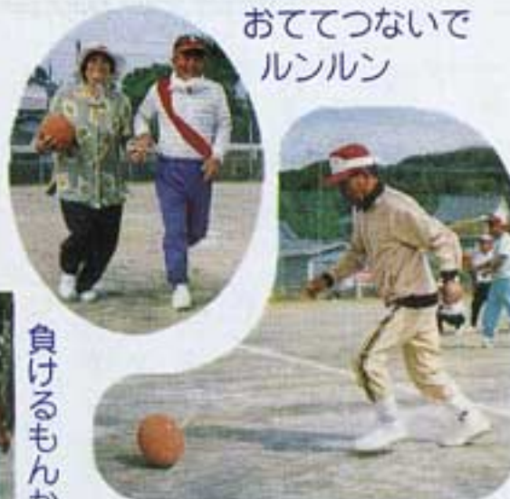
おてつないで ルンルン