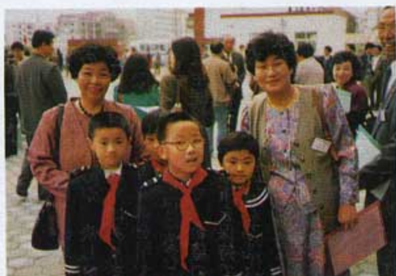
可愛い子供達とつしよに!!

れ胸にジーンとくるものがあつた。歓迎の意味を精一杯体で表現している。教室の黒板には「友好長(友情は永遠に) 日中友好」などの文字が書かれてあつた。十周年記念式典では、アトラクション日向市民吹奏楽部の最後の演奏、チャゲ&飛鳥の「ヤー ヤー ヤー」には、会場全員が総立ちになりこぶしを振り上げ、言葉は通じなくても友好の輪は広がっていった。「謝、謝、ありがとう」団員の一人があいさつをした。このすばらしい思い出は忘れることは出来ないだろう。