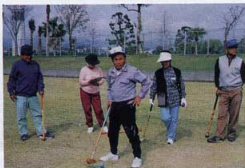
一丁やったるでえ〜