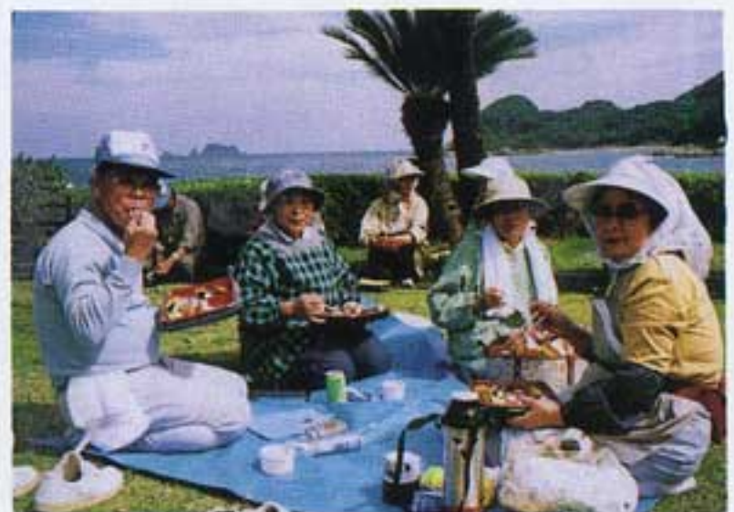
あんたもいつしよに食べんねえ～

は毎年実施しているとのこと。それにしても、海水浴場・公園と広範囲に亘る。今年は参加者も多いと聞いたが、はたして午前中に全部終わるのだろうか？一瞬頭をよぎった。しかし一斉に作業を始めて三時間すつかり変容した。すべて終了である。さすが経験豊かな人たちはかりだと心強く思った。こうした共働、共助活動などを通して生きがいと多くの仲間づくりをしていきたいと思ったことだった。海からの心地よい風と潮騒を聞きながら健康のよろこびをつくづく感じた一日でした。