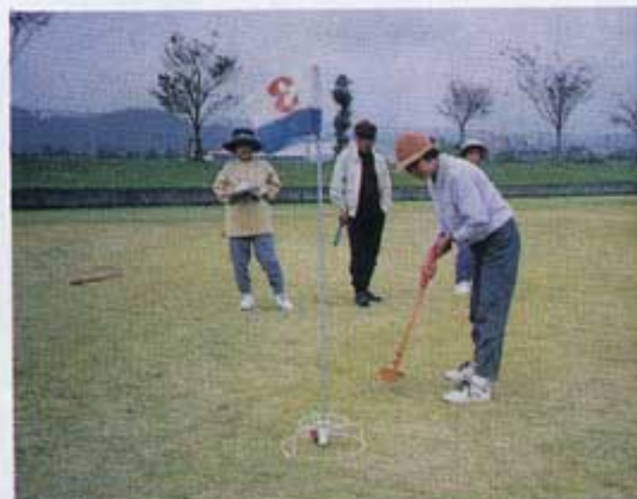
どうか入りますように!!