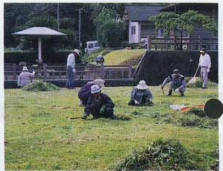
皆できれいにしちやるかいね

十月九日快晴、今年シルバー人材センターに入会して初めての奉仕作業である。八時五〇分、目的地の御銚ヶ浦公園に到着。予定どおり九時に各班毎に全員集合、理事長のあいさつ、そして安全標語、川柳の入賞者の表彰式の後、職員や係の方々から作業内容や安全対策等々の諸注意があった。さあ、いよいよ活動開始。各班ごとに分担区域に別れて作業にとりかかった。この奉仕作業