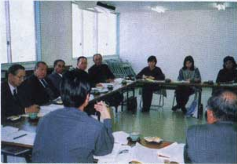
活発な意見が出された研修会

また、十一月には北九州市、 別府市、宇佐市と続けて来られ センター概要、事業運営につい て等話し合いました。