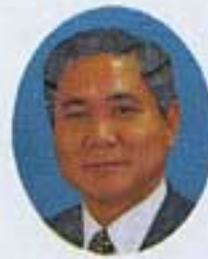
日向市長 赤木 欣康