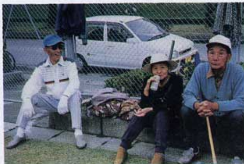
ちょっとひと休み