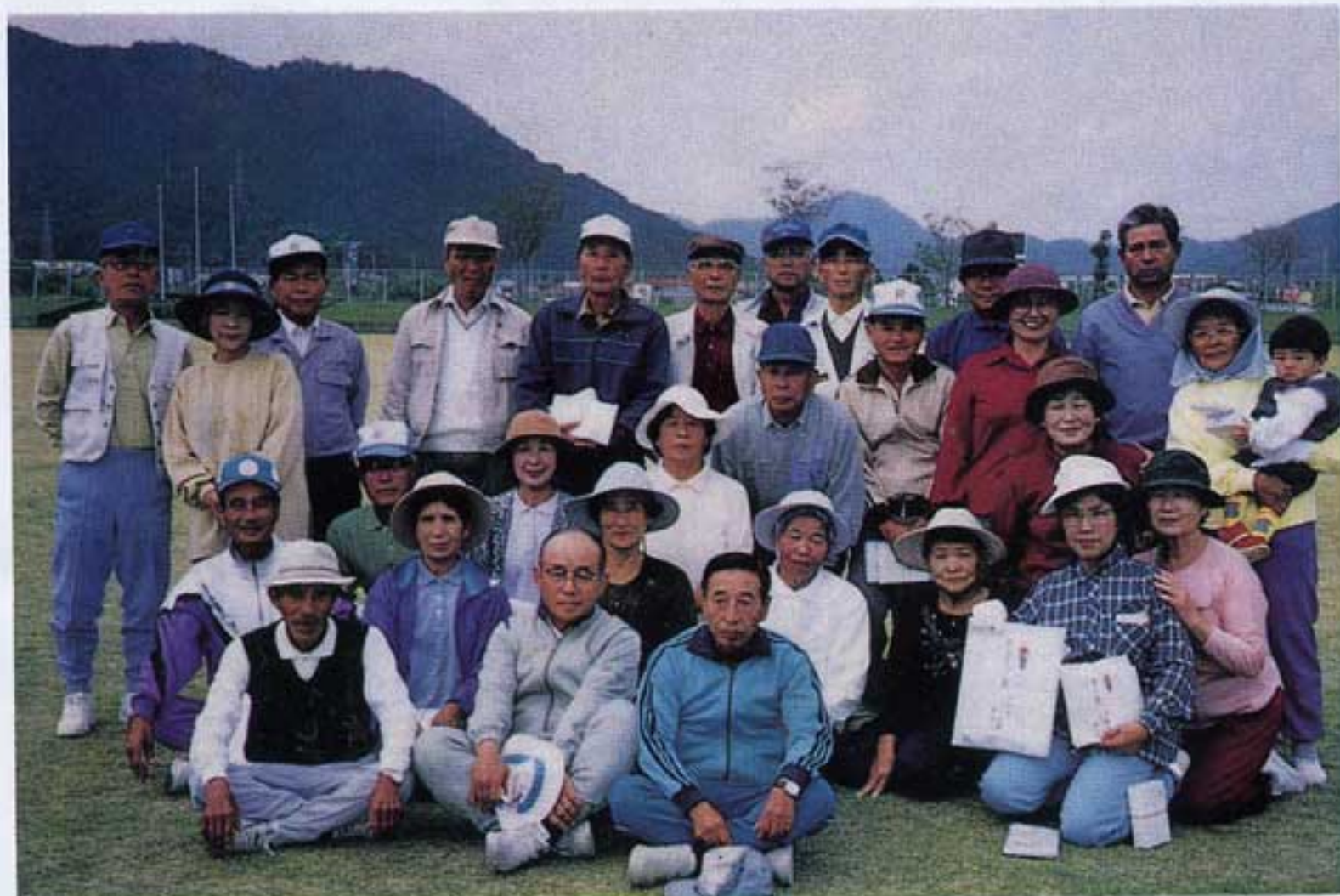
皆、笑顔でハイポーズ!!