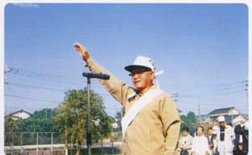
湯地白団団長の力強い宣誓