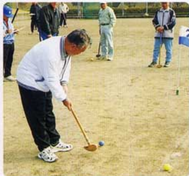
狙い定めて、出口局長