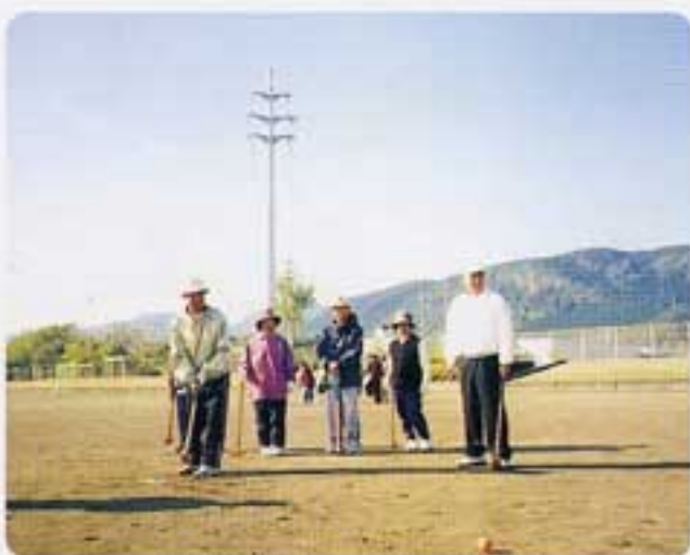
安藤副理事長の奮闘ぶり