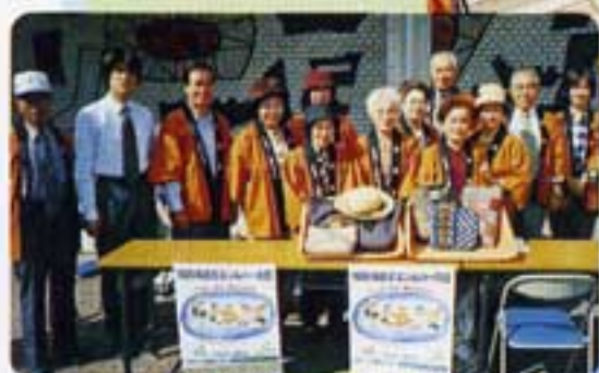
今年も小物販売、売切れました