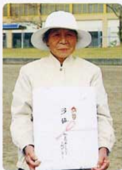
これで充分の浦さん

方でもグラウンドゴルフはそれなりに楽しむ事ができます。一人でも多くの方とまた大会でおあいしたいと願っております。お世話して頂いた皆様、有難うございました。