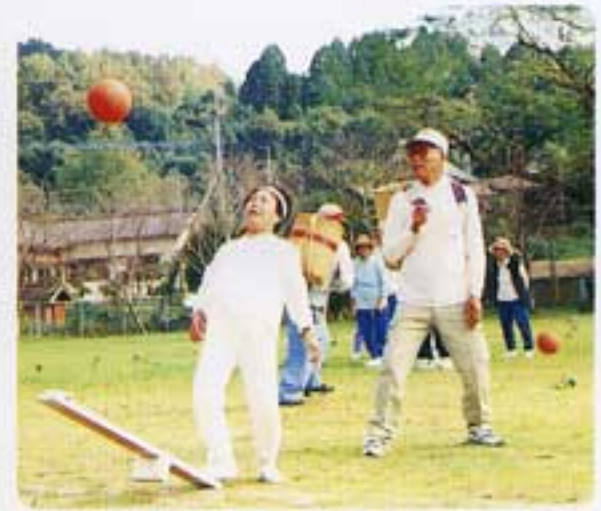
これでは入らない

去る十月二十四日秋空の下でシルバー人材センターの運動会が催されました。私も何か一つでも競技に出られたらと思って参加いたしました。みなさんと心ひとつにして楽しく一日を過ごさせて頂きました。時間の経つのも忘れてしまい、また来年も元気で皆様に逢える事を願って帰りました。本当に楽しい一日を、ありがとうございました。