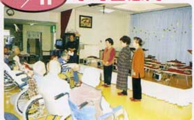
一日も早い快復を