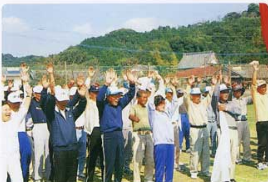
来年も元気で！バンザイ