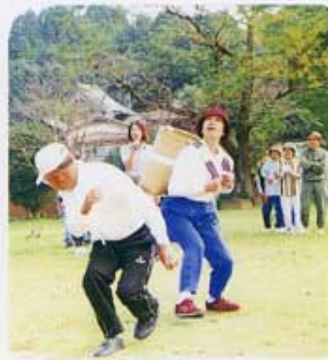
一発で決めた迷コンビ