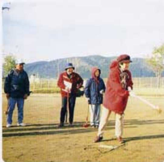
今日の成績は？岩切女性委員長