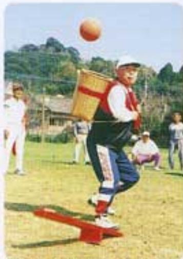
理事長の真剣なまなざし