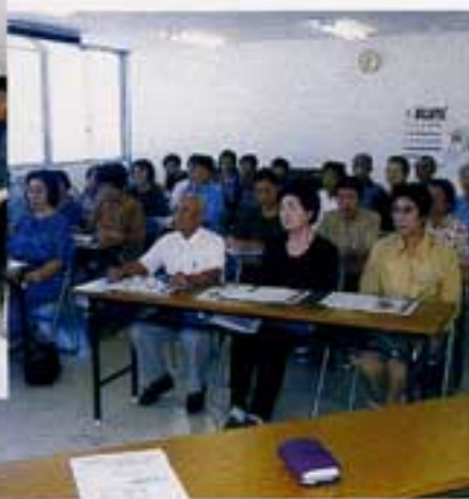
ひと言も見逃すまいと

ています。ある日リハビリについての講習会があると聞き参加させていただきました。延岡の野村病院より、リハビリの先生、看護師介護されているスタッフ多数の方が見えられました。介護を必要とされる方の接し方については外面的な介護だけでなく心のケアの大切さをわかりやすく体の拭き方や床づれにならないように二時間ごとに枕や座布団を使つての体位の変換、おむつの交換などなど、時には笑いを交えて真剣に教えていただきました。リハビリという言葉は知っていても目前にての実技には参加者一同一挙一動一言も見逃すまいとする様子が窺えました。人ごとではなくいつ自分に降り掛かるかわからない昨今です。又このような講習会がありましたら喜んで参加させていたいただきたいと思ひます。