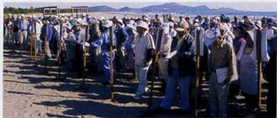
広い浜もこれだけ揃えば