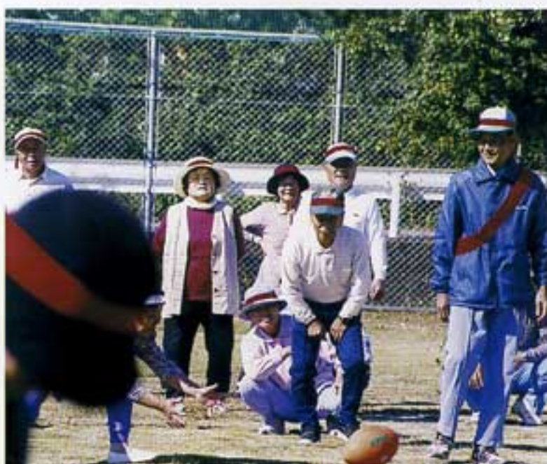
ままならぬラグビーボール

十月二十四日塩見農村公園で行われ、シルバーの運動会に大正琴の人達と一緒に初めて参加しました。晴天に恵まれ多くの会員の方々が参加されていてとても賑やかでした。準備体操も終わり、愈々競技開始です。体が大きくなって走ることが苦手な私は応援での参加と決めていましたが、とうとう団体競技に出る事になり、大きな体を動かすのは大変で「左近太郎」という競技では、ついに転んでしまいました。徒競走に団技にと会員皆さまの元気のよいこと出場毎に爆笑もありその若々しさには、ただ驚くばかりでした。私も団技で転び恥ずかしい思いをしましたが、それに勝る楽しいひとときを過ごすことができました。事務局をはじめ役員の方々どうもご苦労さまでした。