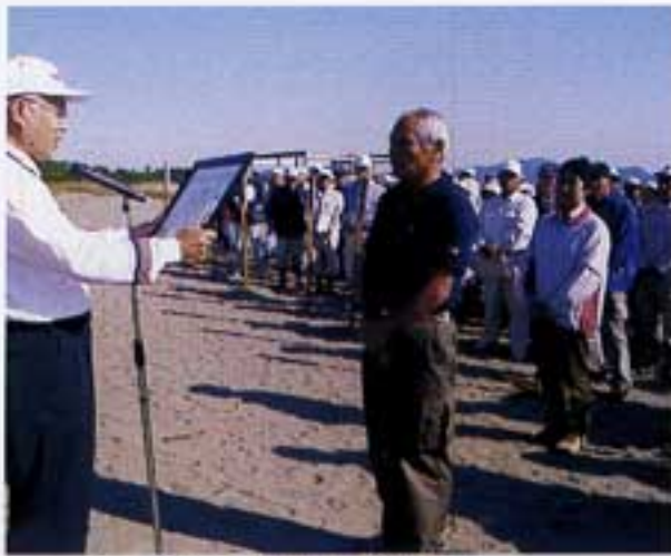
今年是最優秀賞を!