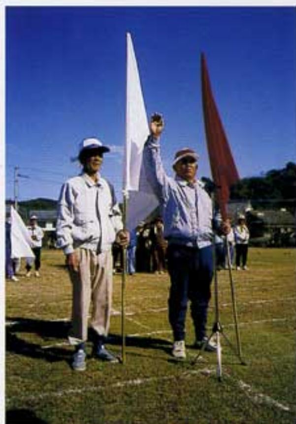
選手宣誓「ゆっくりとどどど」

第十回会員運動会が好天のなか、盛大に開催されました。開催にあたって赤団の団長に選出された私ですが常日頃の運動不足が積み重なってこの体、団長という大役に不安をかかえつつ、然し普段剪定で鍛えた足腰を頼りにやる気十分で望みました。選手会員の皆様も私同様に永年身についた脂肪の体をジャージに包み日頃の疲れを吹き飛ばす勢いで競技に入ったが、気ばかりあせり足がついてこ