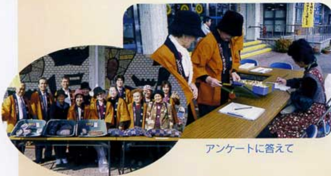
アンケートに答えて