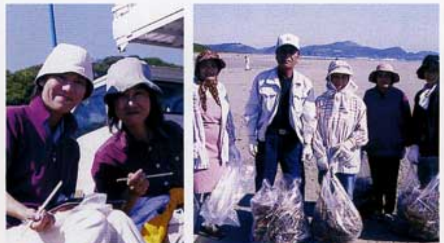
事務局の美人ふたり