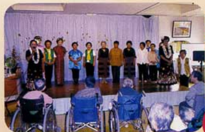
唄って踊って喜ばれた訪問