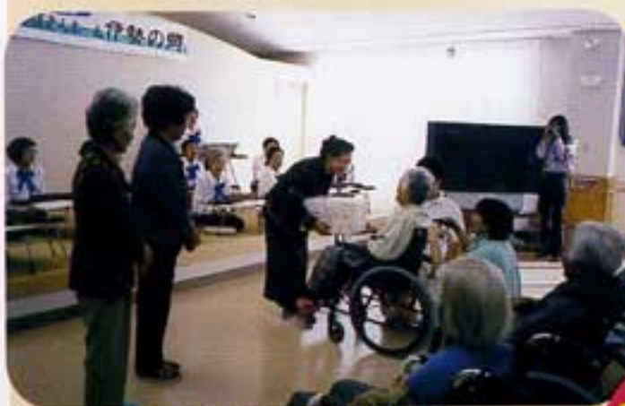
手づくりぞうきんの寄贈