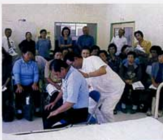
ベットへやさしく

何の目的もないまま会社を辞めてまもなく四年になります。日々の空虚の中で、これでいいのかしら、と思うようになり七月頃友人に話したところシルバー人材センターに入会したらとの誘いをうけました。入会時の説明で小物などを作っている「そよ風会」というサークル活動を知り早速入り現在小物作りにおしゃべりに精を出し週二回の出勤日を楽しみにし