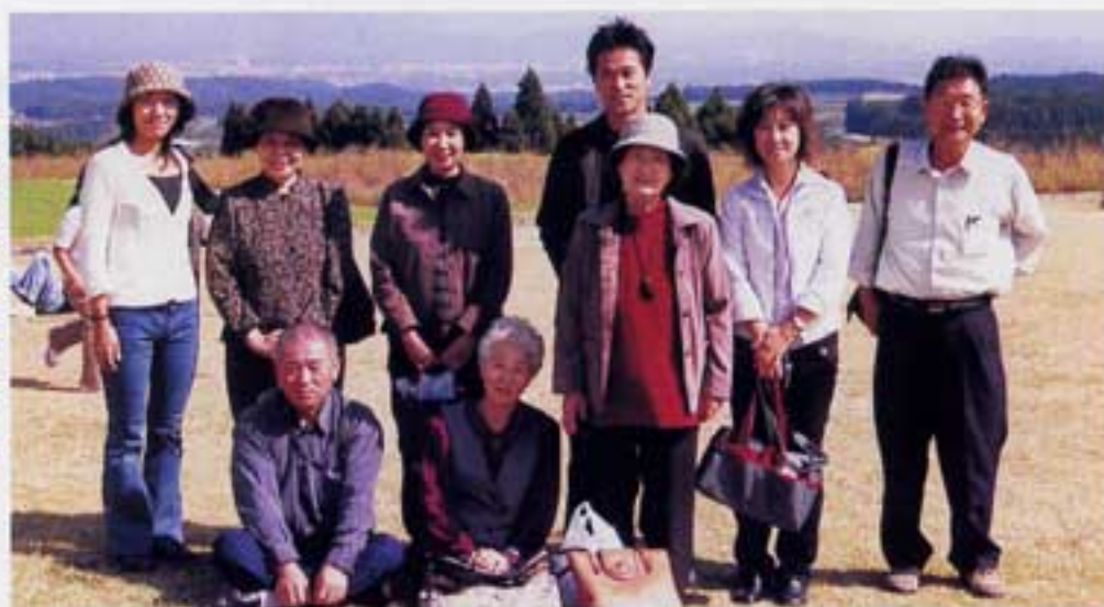
大変勉強になりました

んの経験、知恵を出し合って身近に出来る事から挑戦していきたいと願っています。最後になりましたが大正琴の方達の年三十回という訪問には頭が下がります。今回デイリー新聞の明るい社会賞を受けれ、私共センターの誇りとなりました。菜の花会のため努力の結果である事は言うまでもありません。見習って心新たな教訓にしたいものです。