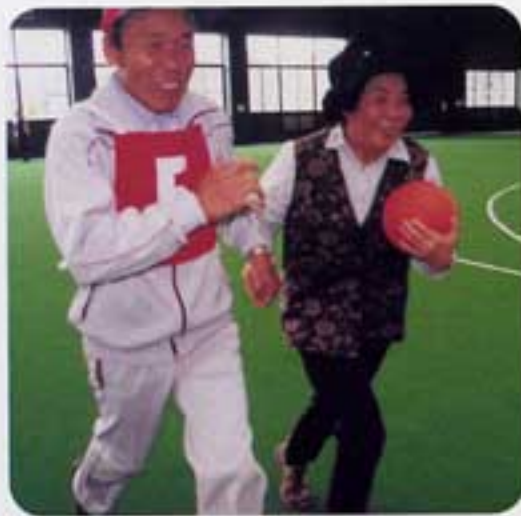
この嬉しそうな顔