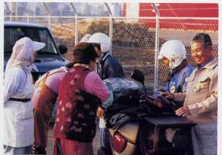
グループ就業の仲間と

三月に勤めていた会社を定年退職し、約四ヶ月間「ゆつくりしないよ」と言う妻の言葉に甘えて、家の周りのことを、こそごそしていたが、何かものたりない毎日、七月頃シルバーセンターのご案内「会員になつて働いてみませんか」と云うパンフレットを見てセンター事務所を尋ねて、入会後さうそく八月始めから仕事を申しつけられ屋外一般作業を希望していたので与えられた仕事は屋外の草刈り作業、今年の夏は猛暑につき、今まで二十年余り夏は室内でエアコンの中の仕事だったので、さすがにこたえた。自分より年上の先輩達が涼しげにきばきと仕事をする姿を見ていると自分もへたばるわけにもいかず、あんまり無理すんなよと休もうかと、と声がかかる、私の為にそれまでより多くの休憩時間をとってくれていたのかと思うとあたたかい心づかいにありがたう、今でも素晴らしいリーダーそして良き先輩の方々にめぐり合えたものと感謝しています。草刈