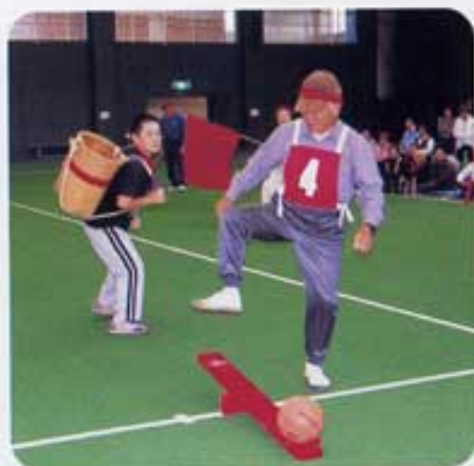
ソーラア箆をめがけて!!