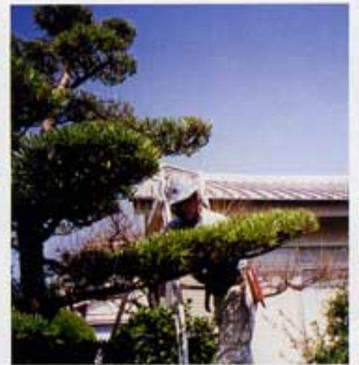
第二の人生に好スタート

定年退職後、第二の人生として、健康管理も兼ね、造園会社で仕事をしていました。知人の誘いもあり、昨年七月シルバー人材センターに入会しました。会員の中心に友人知人が多いのに驚き、毎日を楽しく、和気あいあいと、何の違和感もなく仲間入りができました。健康管理のつもりで入会したのですが、入会早々、夏の炎天下の作業では、アスファルトの反射熱で少々バテ気味でした。然しお客様から「綺麗にして頂きありがとうございます」と喜んでもらうと、やり甲斐を感じ次への仕事にファイトが沸きます。仕事が終わって事務局に帰った時、職員の方々が「お疲れさん」と迎えて下さるその瞬間仕事の疲れが取れ心が癒やされます。今後は諸先輩方のご指導を仰ぎ、安全に心掛け、健康に留意し頑張りたいと思います。会員の皆さん今後共よろしくお願い致します。