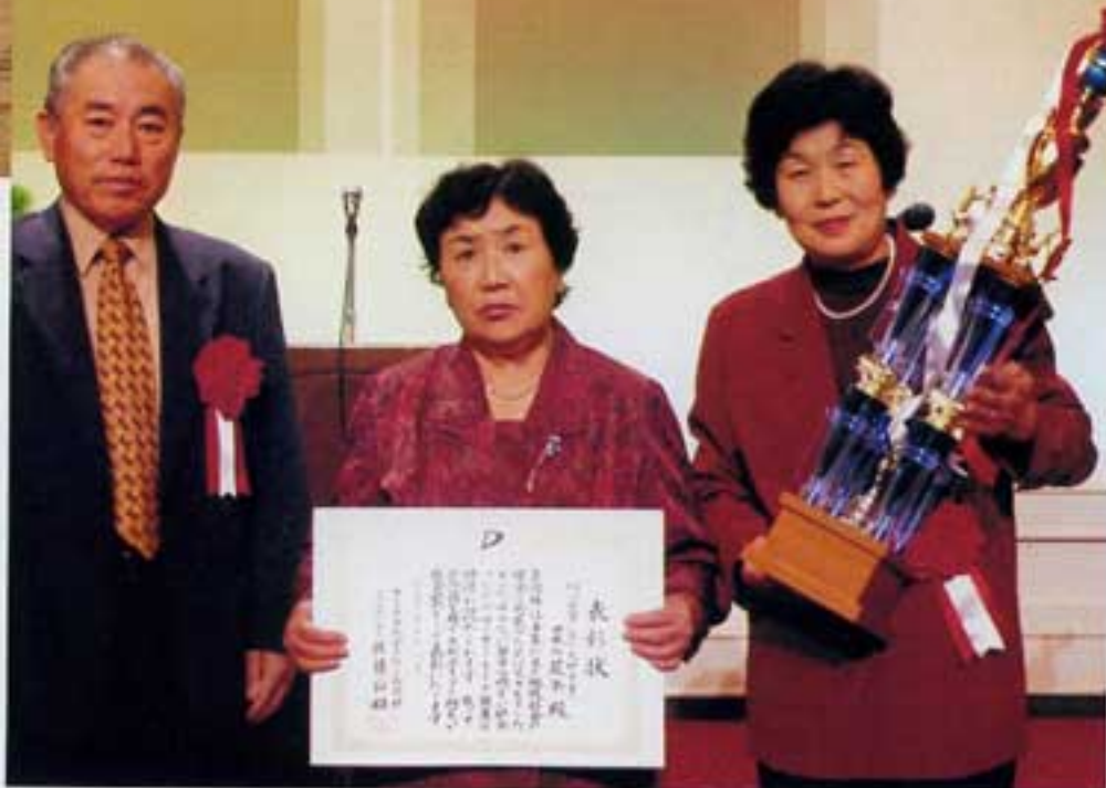
今後も決意新たに