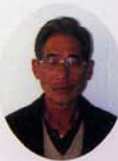
日知屋 枝郷A班 福島 吉巳

四年前の第六回グラランドゴルフ大会において、大会参加三回目にして初優勝し心わくわくして感慨にひたっていたことを思い出しております。私もそれ以来毎回参加