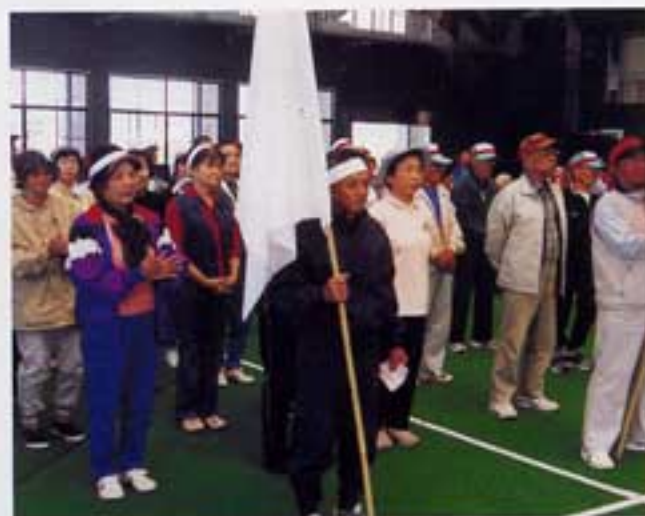
必勝期して赤団白団勢ぞろい