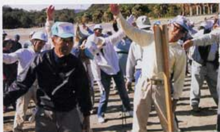
準備体操はバラバラ