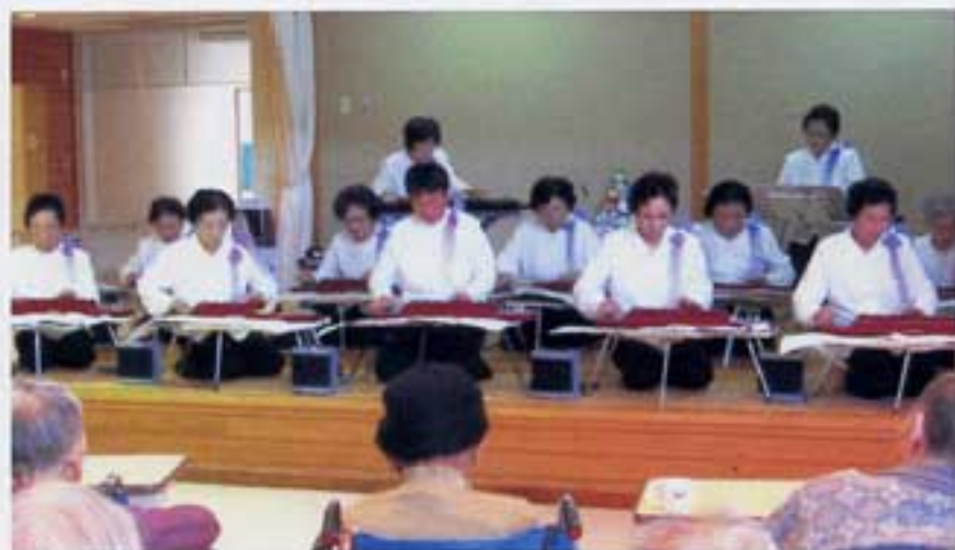
この練習成果が実を結ぶ