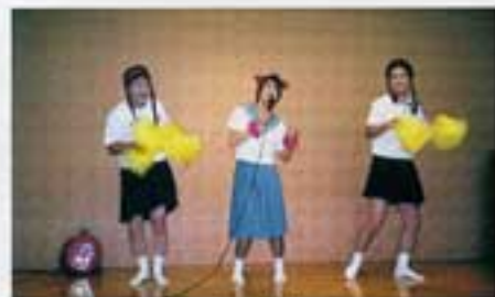
今年の締めくくり