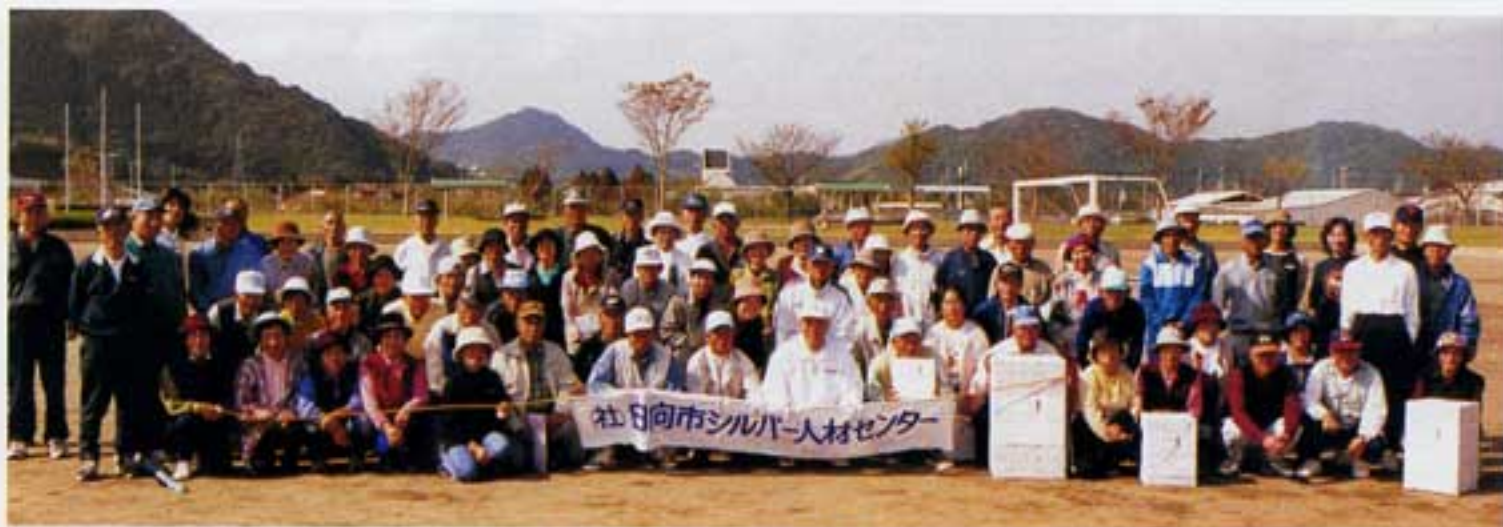
入賞者を始め参加者全員喜びの顔