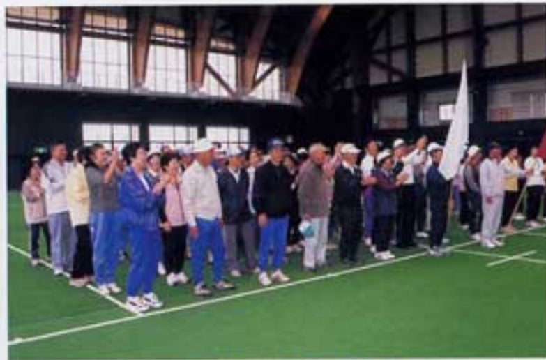
サンドーム内に大集合