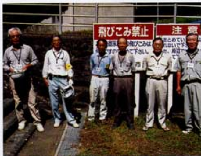
奥野河川プール監視員で～す。

この提出がなかつたりおくれたりすると、会員の皆様への配分金支払いが遅れることもありまますので間違いなく月初に提出されるよう重ねてお願いします。