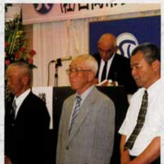
東郷町の新理事さん