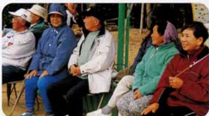
応援で寒さも忘れる

がらもマウンドに立ちました。チームメートの奮闘で私達の北軍に勝利の女神が微笑んでくれました。今でも当日を思い出せばなつかしく感じています。又試合終了後の表彰では、最優秀の賞品までいただき、有難うございました。