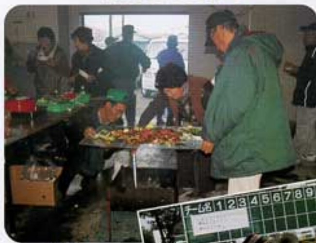
焼肉。これが楽しみ

境に北と南に別れて、プレーボール。年に二回の大会なので珍プレー続出、なかなかバットにボールが当たりません。次の打席ではと思いバッターボックスに立ちサア打つてもアウト。ピットがでらずファーストが遠く感じられました。グローブを手にするのもバットを握るのもこの大会の時だけです。大部分の会員さんも同じと思います。打てないとバットのせいに。ボールがグローブからポロリ、グローブのせいに。終わってみれば今年も北軍の勝利でした。試合が終われば例年の如く焼肉会。腹一杯に美味しい焼肉と優秀賞品まで手にすることができて感謝感激、たのしい日でした。来年も頑張るぞ。