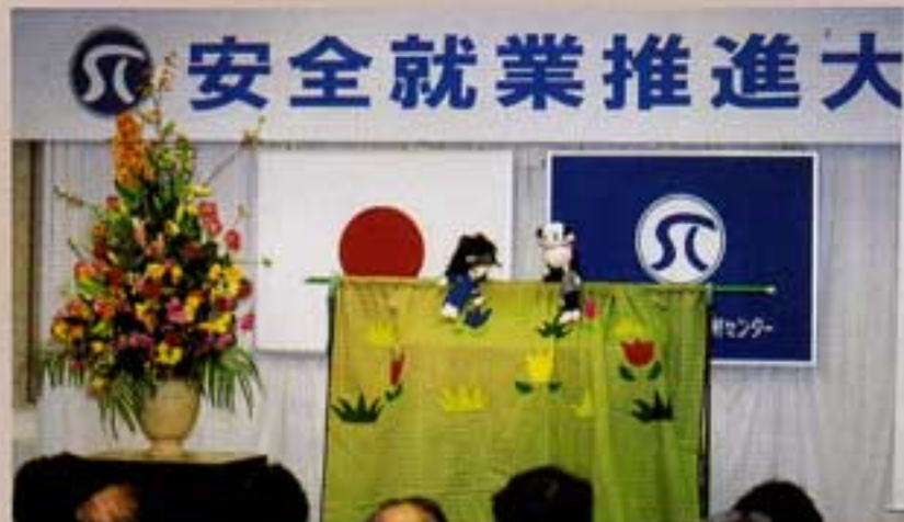
安全に人形も一役