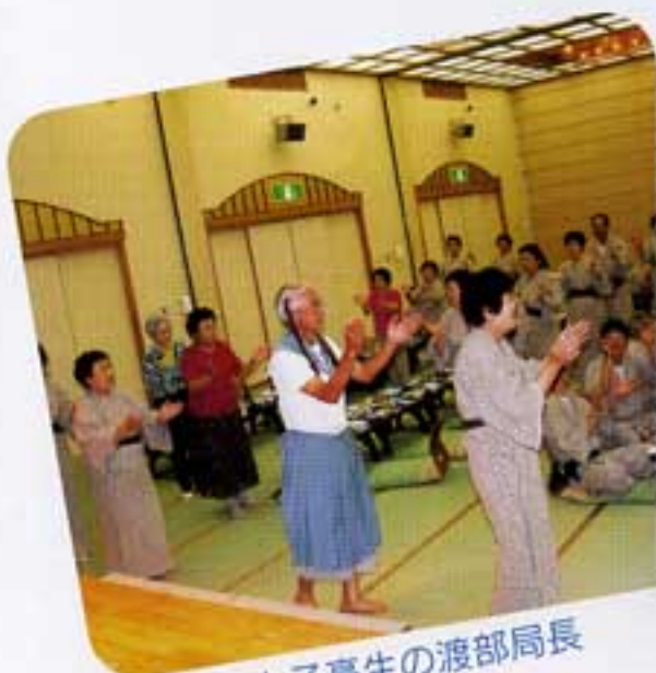
女子高生の渡部局長

二日目、九時ホテルを出発して嬉野陶彩館、日田市内、サッポロビール工場見学。二日目も楽しく過ごし、あまり笑ったことでシワが増したかも？でも心のシワがとれていくつも若くなった様です。二日間楽しく旅行ができた難うございました。