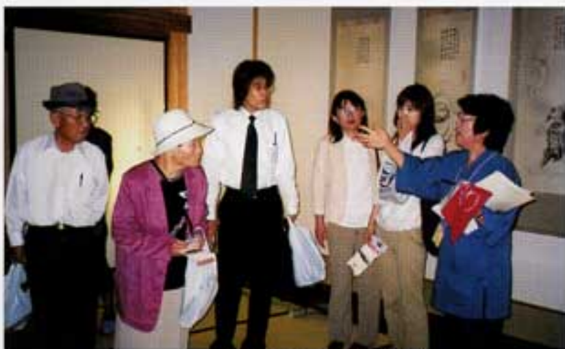
本丸にて歴史の勉強

二月二日お雛様の時期に合わせて、綾町シルバー人材センターへ見学に参りました。センターの敷地内にもひな山が飾られ畳五畳程に山水の風情の中に七段飾りが飾ってあり、大変手の込んだ仕組には感心させられました。所でセンターの運営内容と申しますと、