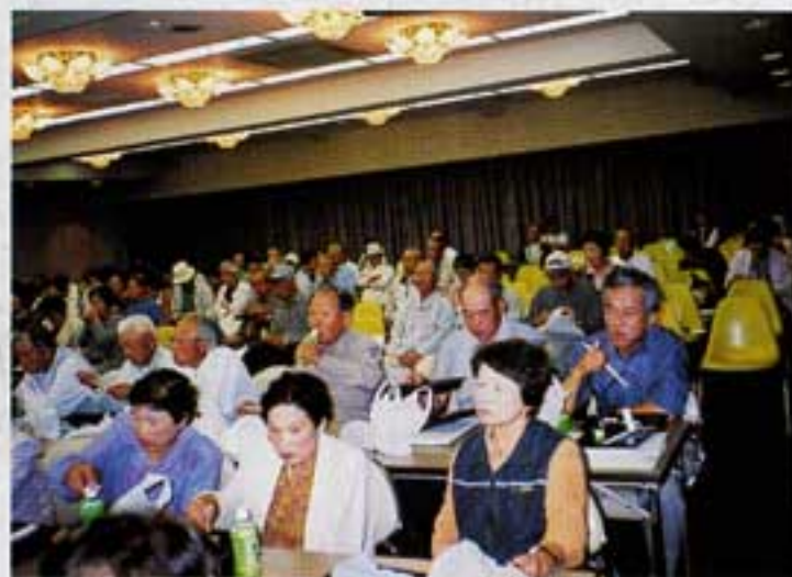
踊りを見ながら昼食

た。当日の会がスムーズにいきましたことは、会員の皆様の協力あつてのことと深く感謝申し上げます。最後に日向市シルバー人材センターの今後益々の発展と会員皆様のご健勝を祈念します。