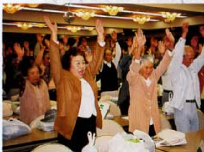
又、来年～バンザイ三唱