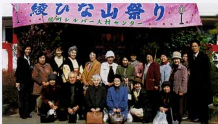
そよ風会、当日の参加者

市の所有地を(一町二反)借りて農作物、もち米、そば、唐芋等を栽培されもち米は餅、赤飯に。そばはそば打ち名人がおられ、持ち帰りは勿論その場で食べる事も出来て、仲々、心の行き届いた趣向に特色ある綾シルバーセンターの努力されてる姿に心を打たれセンターを後にしました。帰りは焼き芋のお土産を頂きありがとうございました。 この一日を振り返り私共のセンターも現在よりこれから新しい挑戦を目指していきたいと願っております。