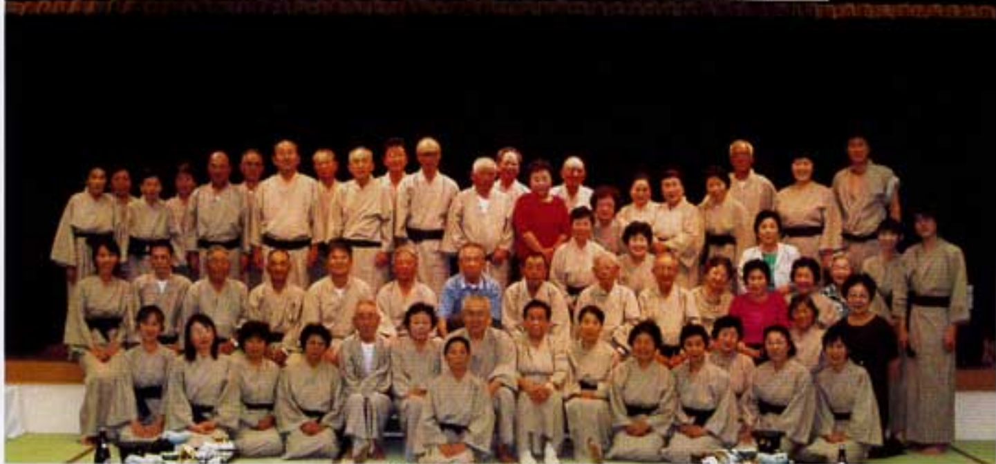
浴衣で全員勢ぞろい