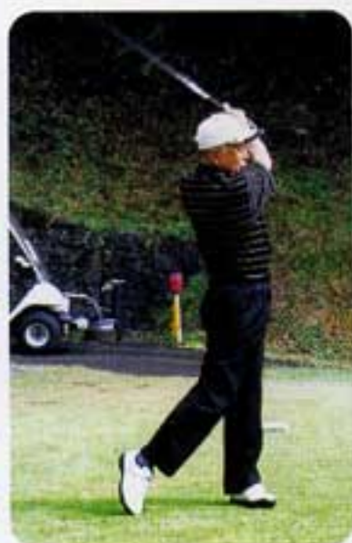
理事長のナイスショット