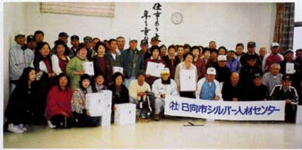
雨の中、たくさんの参加