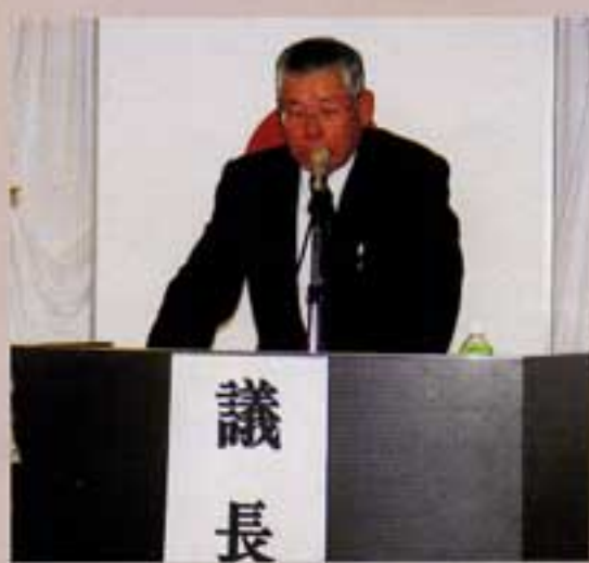
単独最後の議長役

本会においての皆さんからの活発なご意見等から、今後のシルバー人材センターへの更なる発展を期待する意気込みを強く感じた次第です。今後ともお互いに健康に留意しながら、シルバーパワーを発揮し、住みよい環境づくりをめざしたいものです。