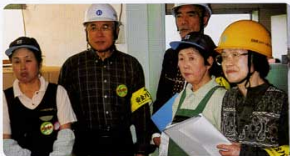
安全パトロールにて

②ゴルフ オフィシャルハンディ12.8! シングルになれるかと夢を追っています。 いします) 十七年度 宮日本因坊戦 ベスト4 十八年度同、三次戦へ進出 最近実力以上の調子が出ています。