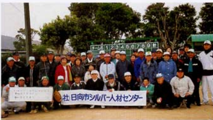
戦いを前に全員集合