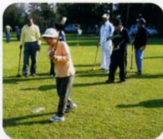
ナイス フィニッシュ!!