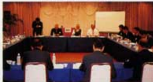
事務局長の意見交換