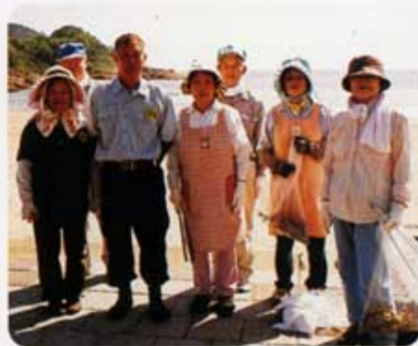
伊勢ヶ浜をバックに