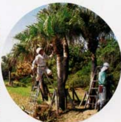
剪定も手ぎわよく

私は今回で四回目の参加になります。日頃逢えない人やなつかしい人達に逢えるのが楽しみです。大勢の会員さんの参加により、来た時よりも短時間で見違えるようにきれいになりました。皆様ほんとうにお疲れさまでした。これからは健康第一に、いつまでも参加出来るよう頑張りたいと思います。