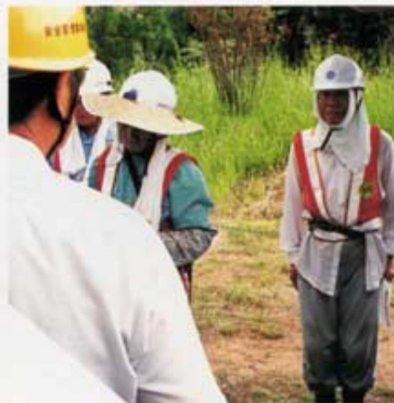
ミーティングに直立不動