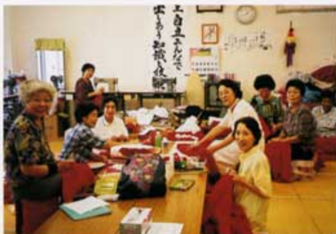
注文のひよっこ踊りの衣裳づくり