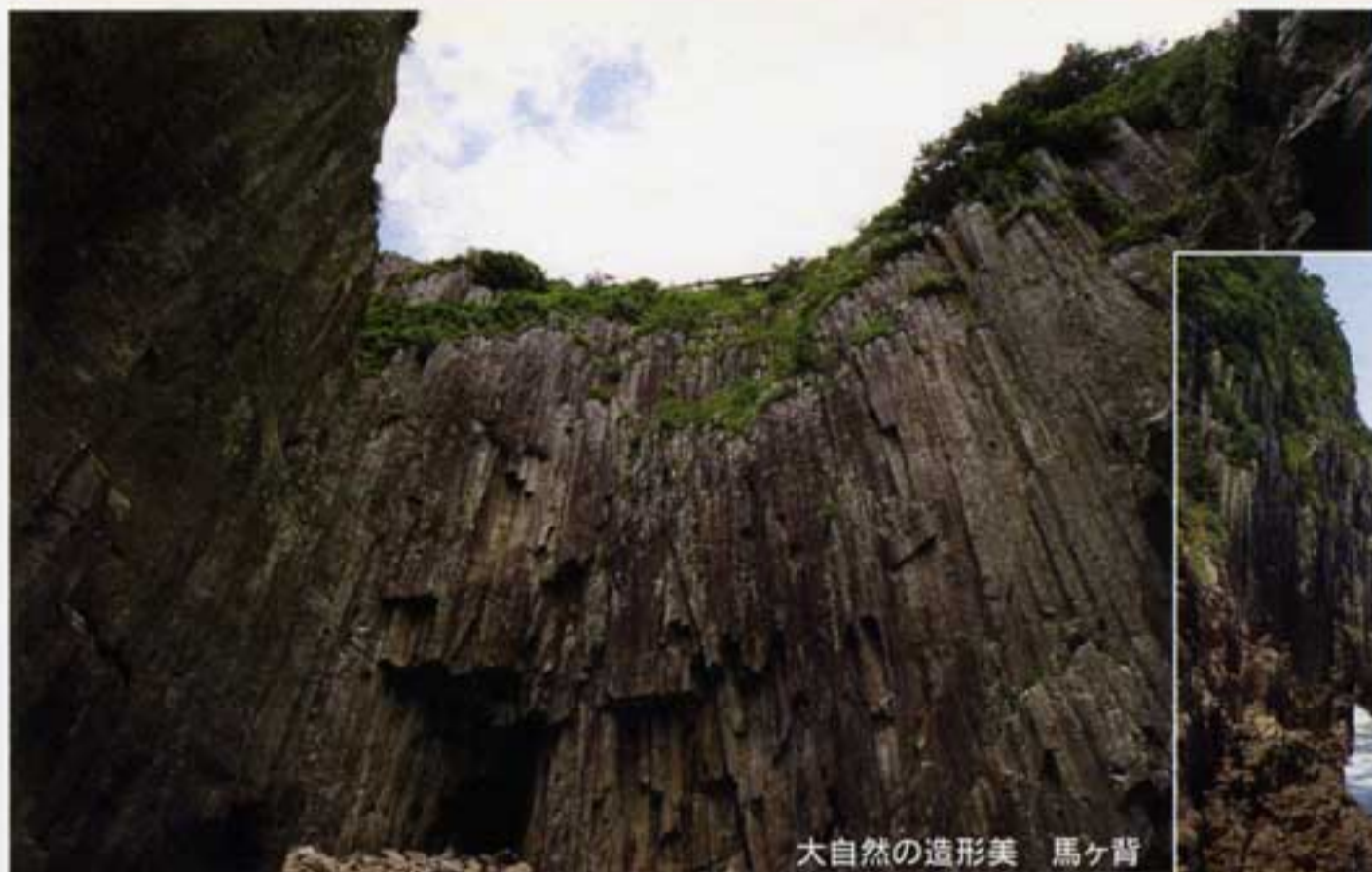
大自然の造形美 馬ヶ背

(社)日向市シルバー人材センター 〒883-0021 日向市大字財光寺847番地1 TEL (0982) 52-2200 FAX (0982) 52-3476