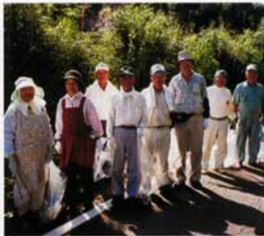
観光道路もさっぱりと