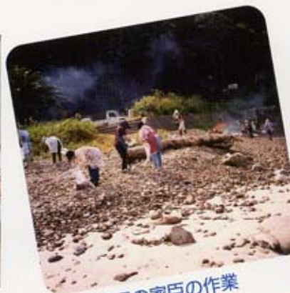
黒田の家臣の作業