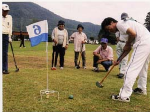
兵頭次長も悪戦苦闘