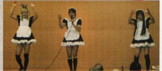
今年の流行語ゲー!!