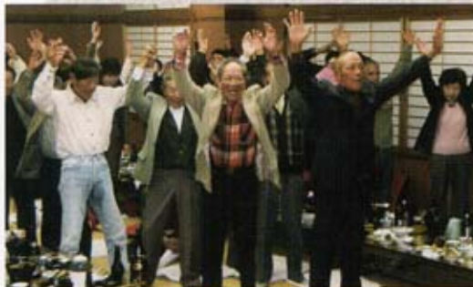
パンザイで締めくくる