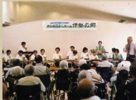
10/24 (金) 伊勢の郷訪問