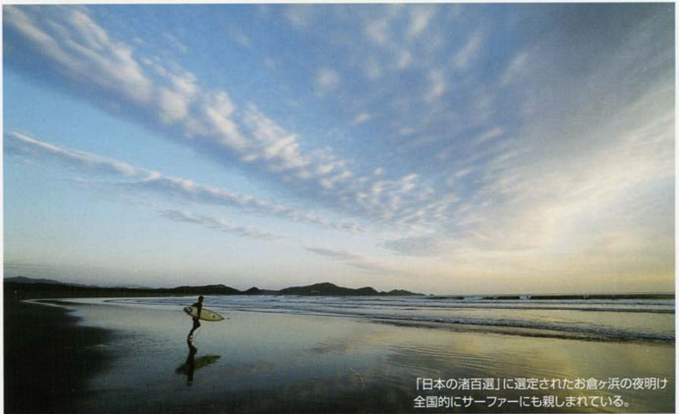
「日本の渚百選」に選定されたお倉ヶ浜の夜明け 全国的にサーファーにも親しまれている。

編集発行 （社）日向市シルバー人材センター 〒883-0021 日向市大字財光寺847番地1 TEL (0982) 52-2200 FAX (0982) 52-3476