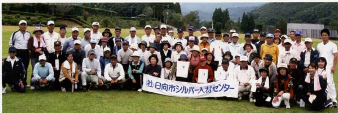
牧水公園に勢ぞろい

去る十二月七日、心配していた天気にも恵まれ、すばらしい牧水公園で第十八回グラウンドゴルフ大会が行われました。入賞された皆さん、おめでとうございます。