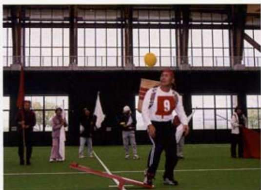
今度こそ入ってくれ