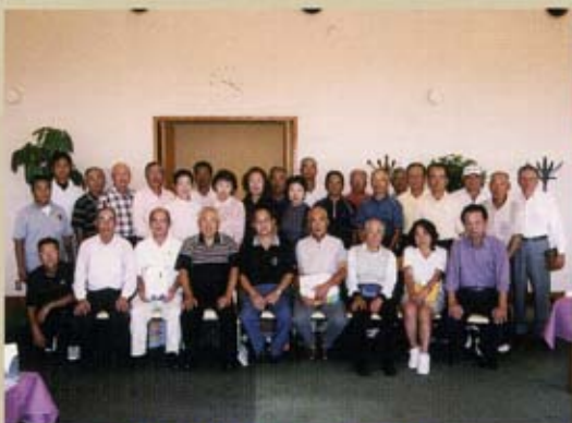
10/20 (月) 大会を前に