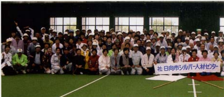
北京オリンピックの年 会員230名躍動す