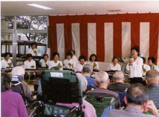
メンバーとしてのよろこび

今後も多くの人々と出会い、適度の刺激や緊張、喜怒哀楽を味わいながら、歩また二歩、前進できたらと思います。会員の皆様と共に健康で楽しい日々を送りましょう。