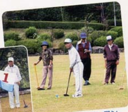
狙うぞホールインワン