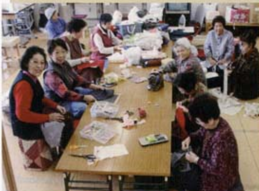
福祉バザー用の作品づくり