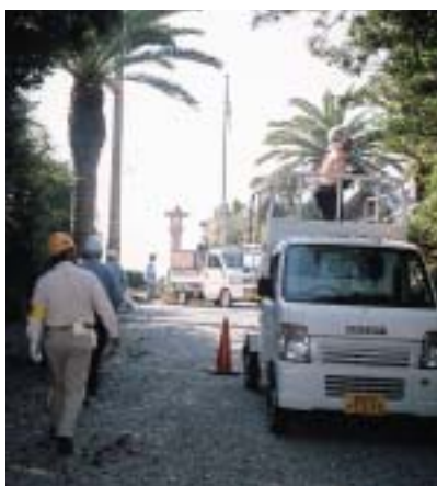
高所車でさっぱり

全標語の表彰式・体操などを終え、現場へ移動しました。私達の班は昨年について黒田の家臣。大きな流木などチェーンソーで切り、雑木・雑草なども集めて数ヶ所で焼却しました。大きくて焼却できない流木を移動するのが大変で、男性二、三人で砂利の上を転がしながら運ぶのがやっとでした。どうにか午前中に作業を終えることが出来ました。 何時も思うのですが、会員の皆さんの高懸命な働きぶりに本当に感心致します。作業を終えきれいになった海岸での弁当は又格別でした。今後も行事に参加し会員の皆さまと親睦を深めていきたいと思えます。