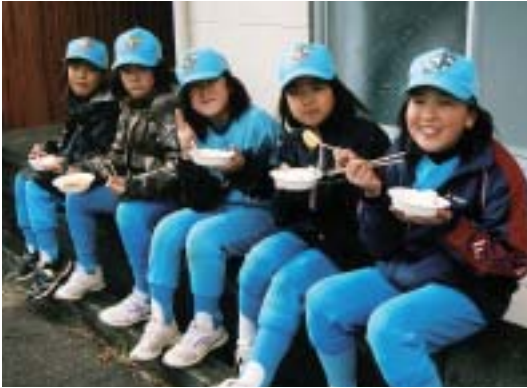
チョコおいしいネ