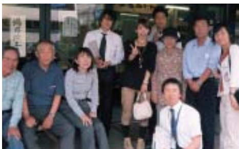
土産コーナーにて