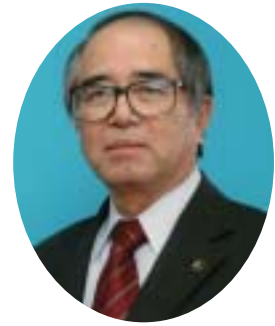
日向市長 黒木 健 二