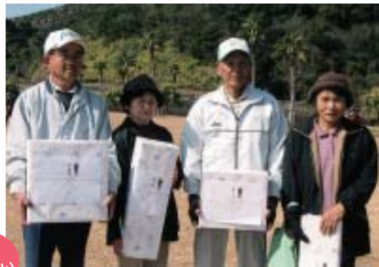
グリーンパークにて115名参加