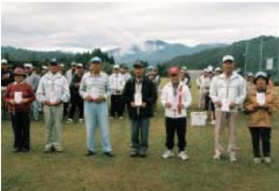
牧水公園にて84名参加