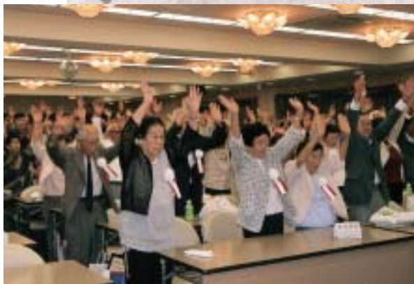
バンザイで締めくくり