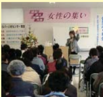
とても良い講話でした。