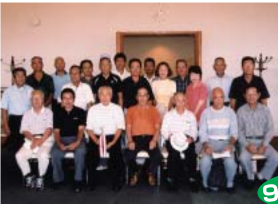
ゴルフコンペ参加者

はバスをお二人ともとても大切にしてくれることです。時間外でも丁寧に洗い拭き翌日は気持ちよく子ども達が乗車し喜んで登園してくれます。又三月より新車の赤いロンドンバスが走ります。子どもは大喜び！しかし自分の背丈の倍あるうバスの洗車は大変でしょうがいつもピカピカです。運転以外にも泣いている子どもを抱いてくれたり、みかん、いもの収穫作業には大活躍。今ではなくてはならない私達の頼もしい仲間です。すばらしい人材確保に努めてくれるシルバー人材センターに感謝です。