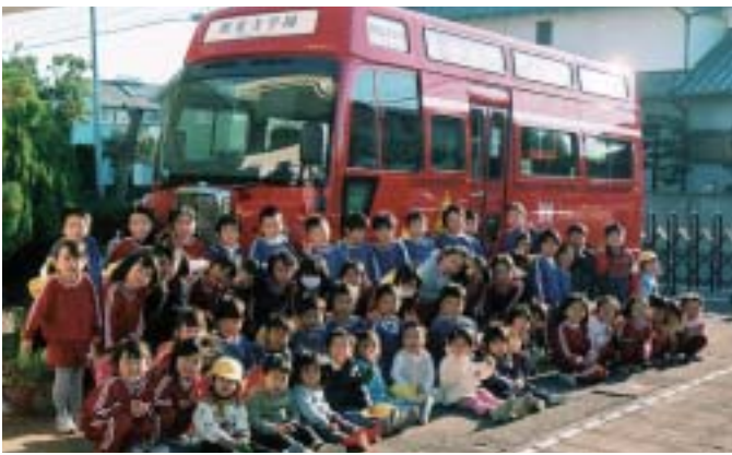
ロンドンバスと園児たち

シルバー人材センターとの出会いは三年前、専属の先生が急病になりバスの先生を探す中「シルバーさんにお願ひしましょう」の園長先生の一言からでした。バスの先生から見たら孫のようなことも達、お互いの関係がほほえましくとても安心しました。道路の段差は徐行。信号が黄色になったら早目の停止、運転手としての心がけにはとても感謝します。何より頭が下がるの