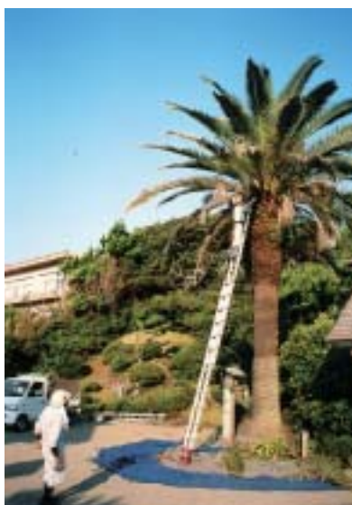
境内のフェニックス

シルバーの行事の奉仕作業は、運動会、グランドゴルフ大会など十月、十一月に行事が集中している中で、十月十六日に行われた。 まず伊勢ヶ浜海水浴場に集合し、安