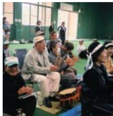
白団、太鼓でがんばれ