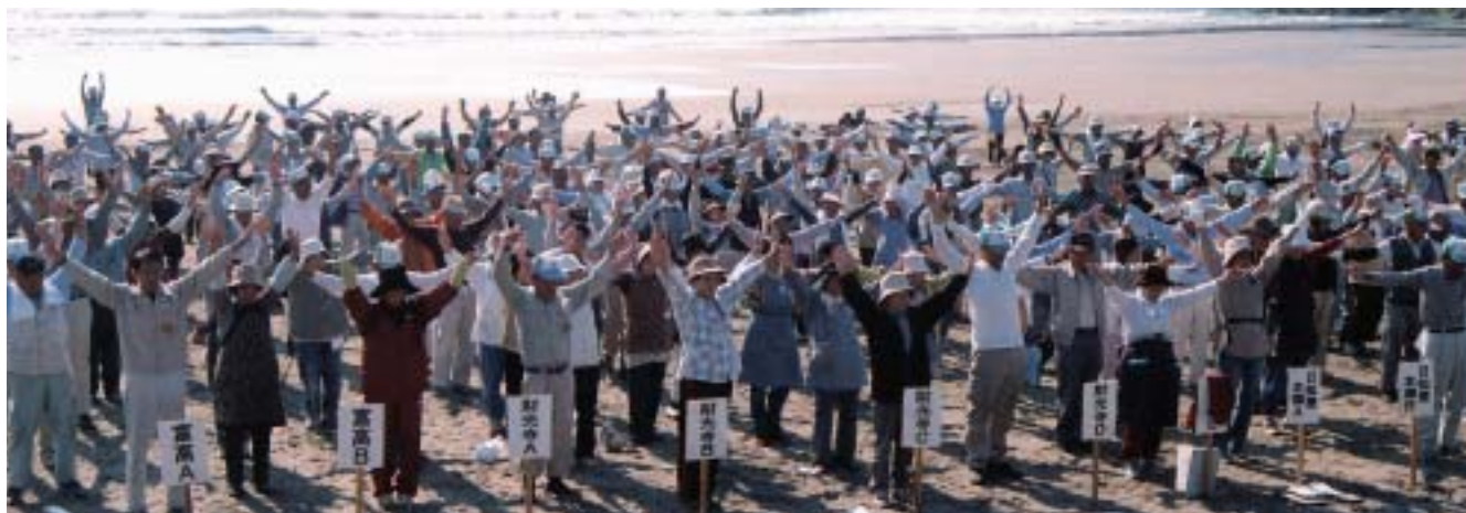
奉仕作業前の準備体操(伊勢ヶ浜にて)

編集発行 (社)日向市シルバー人材センター 〒883-0021 日向市大字財光寺847番地1 TEL (0982) 52-2200 FAX (0982) 52-3476