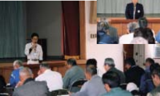
兵頭事務局長による安全就業についての講話