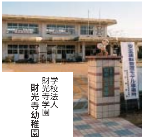
学校法人 財光寺学園 財光寺幼稚園

て長く長く頑張ってくださいと思います。最後に、シルバー人材センターさんがこの先も私たち若輩者の手本となる労働者としての姿を見せて頂けたら、私たちもしっかり見習って精進して行きたいと思えます。仲良く力を合わせてこれからもお互いに頑張っていきたいと思います。