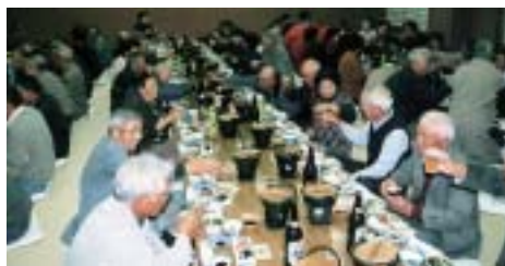
今年のしめくくり