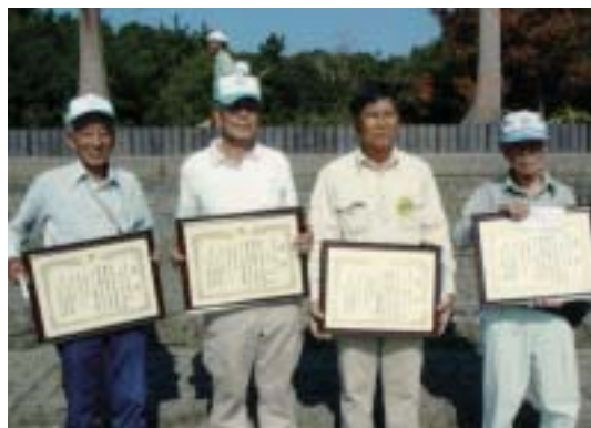
安全標語の表彰者