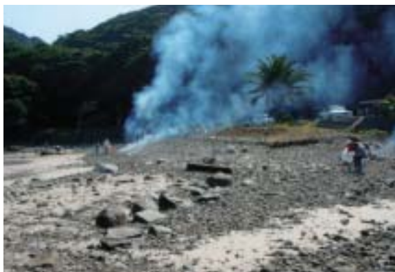
黒田の家臣もきれいに