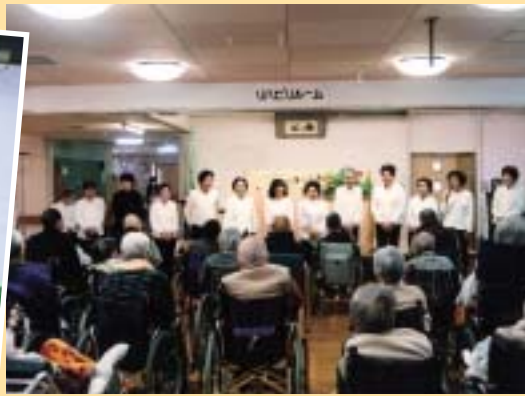
入所者の皆さんと