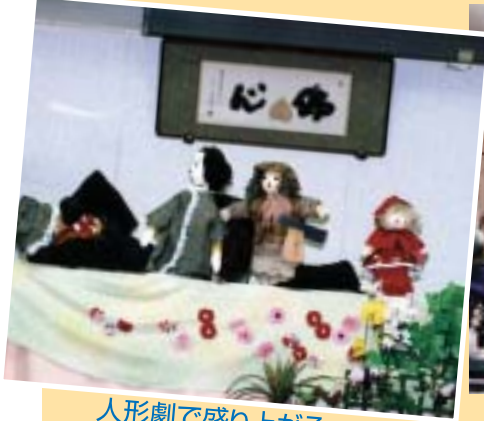
人形劇で盛り上がる