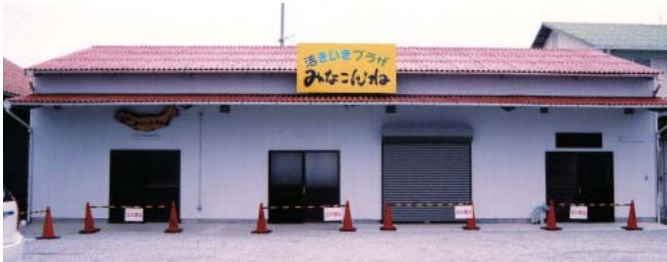
活きいきプラザ みなこんね

編集発行 (社)日向市シルバー人材センター 〒883-0021 日向市大字財光寺847番地1 TEL (0982) 52-2200 FAX (0982) 52-3476