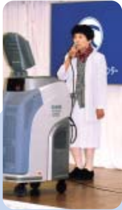
「うたかたの恋」の甲斐さん