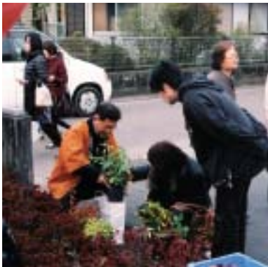
植木鉢も売れました。