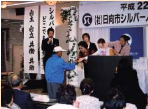
賞品は何でしょう?