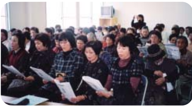
みんなで歌う「早春賦」

然の中で過ごした様子等情感たっぷりな朗読とお話でした。当日は、菜の花会の皆さんの大正琴の演奏を聴かして頂き、上手でいき活きと演奏されているのに刺激を受けました。私は入会して一年が過ぎました。初めての仕事を先輩方の指導のお陰で楽しく務める事が出来、視野も広く成りました。一人ひとりの特技特長を生かし、適材適所に配置し何時も笑顔で接して頂くセンターの職員の皆様にも感謝しています。これからも宜しくお願いします。