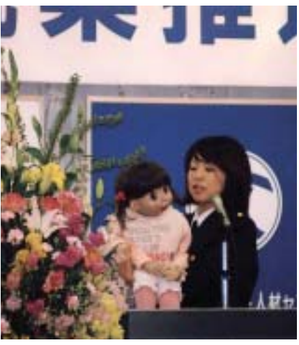
「車に気をつけてネ。」