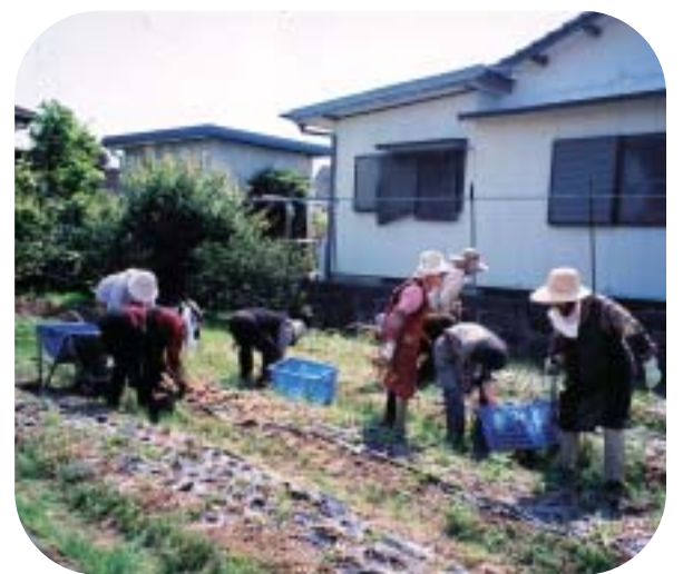
そよ風会の玉ねぎ収穫

施設は展示販売所と4つの作業場に整備され、今後会員の皆様の活動拠点として、また市民との交流の場としても有効に活用していただけますことを期待いたします。