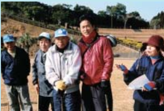
寒そうに打順待ち

二月三日、グリーンパークでのグランドゴルフ大会に参加し準優勝でした。昨年の牧水公園では優勝、その前年も準優勝と入賞を果たし満足しています。げんのない牧水公園で今秋は又、優勝を目指して頑張りたいと今から大いに意気込んでいます。