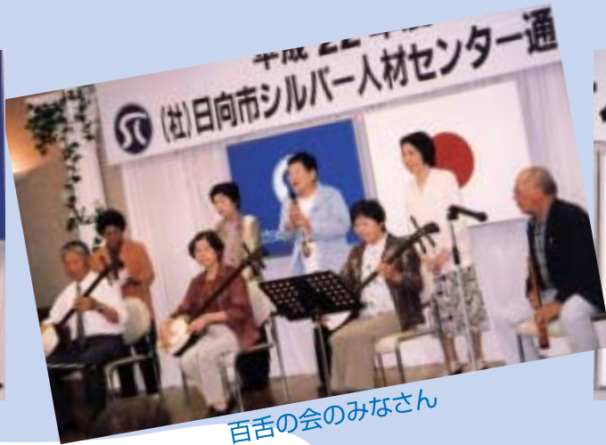
百舌の会のみなさん