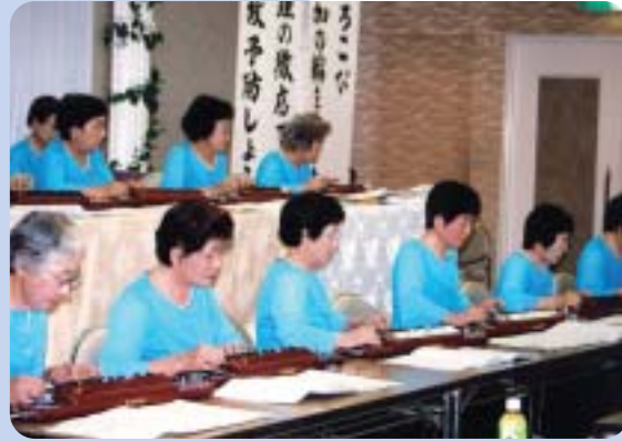
新しい“装い”で演奏