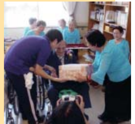
牧水園へぞうきん寄贈