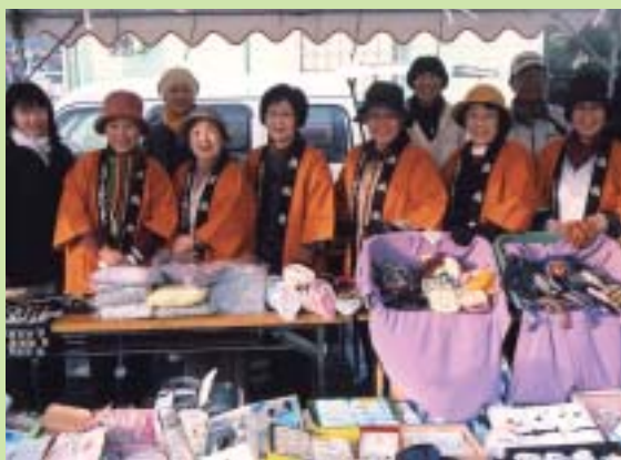
準備がととのいました。

これからもこのような活動を続けていきたいと思しますので、会員の皆様のご協力をお願いします。