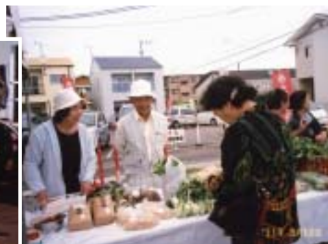
お買い上げありがとうございます