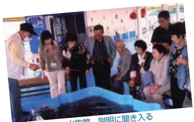
水族館、説明に聞き入る