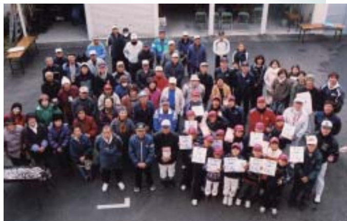
世代間交流(参加者全員)