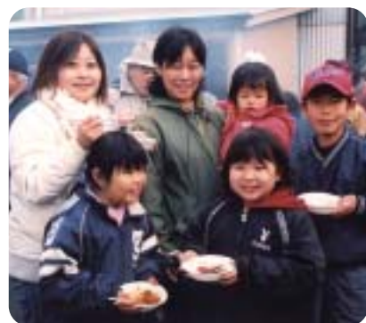
焼肉、おいしかったよ