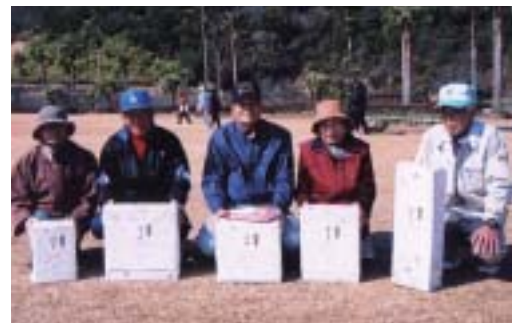
グランドゴルフ入賞者