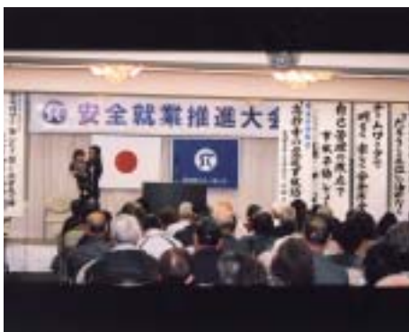
人形での安全教室