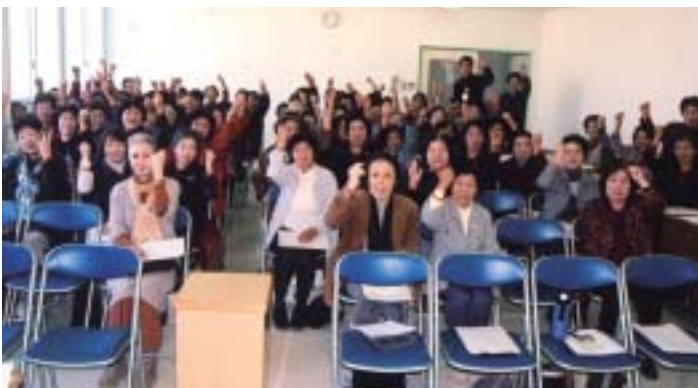
全員一体となって

認知症で人が困っている時地域で支え合おうと養成講座を開き、修了者にはオンラインリングが配られ、そのサポーターの数は市内で二三四名だそうです。今回の受講者は七二名でした。認知症の怖さを知り自分に出来る予防策は、適度な運動、イベント・サークル等への参加をし、人との交流を計り脳へ刺激を与え、活力ある生活をし、健康寿命を延ばす様努力していきたいと思