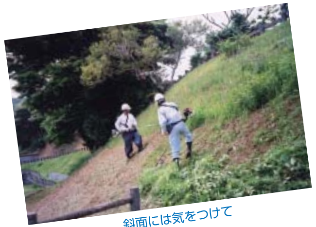
斜面には気をつけて