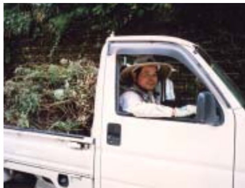
「がんばっています。」

入会して間もない若輩者ですが、センターの趣旨に沿う、お客様の満足する作業を安心して任される会員に一日でも早くなれるよう頑張りたいと思っております。今後ともよろしくお願い致します。