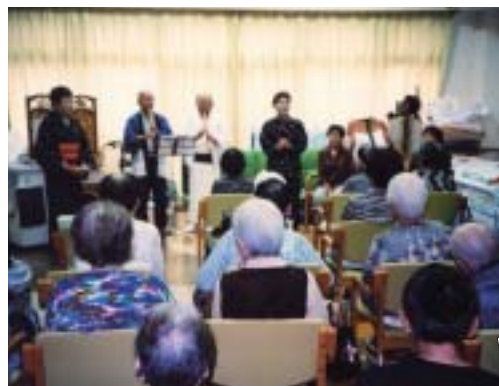
スカイホームの皆さんと