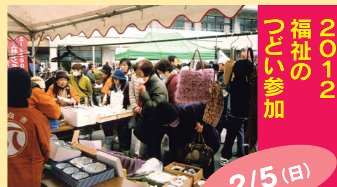
目星しい物は売り切れ