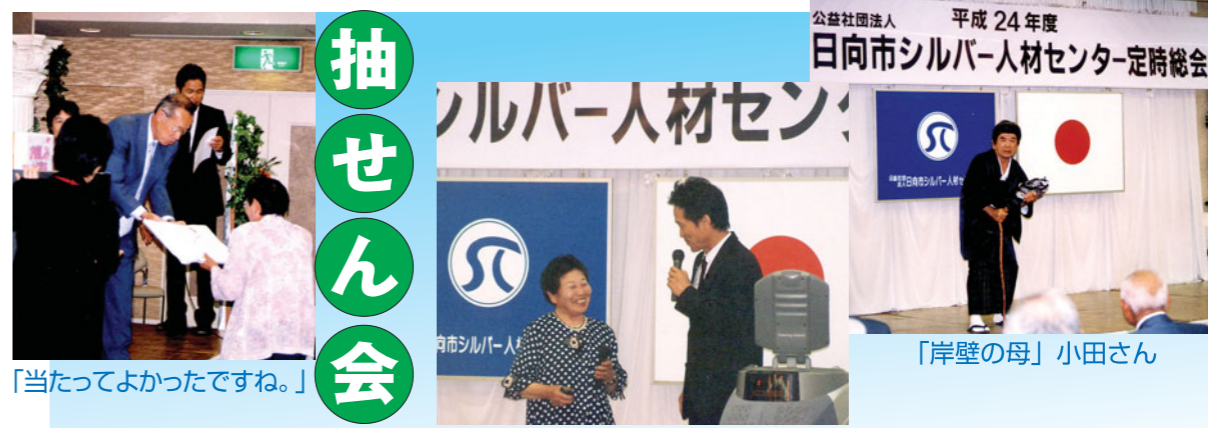
「当たってよかったですね。」