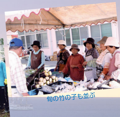
旬の竹の子も並び