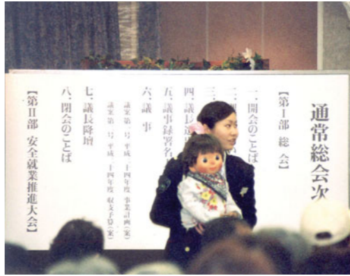
腹話術で交通安全