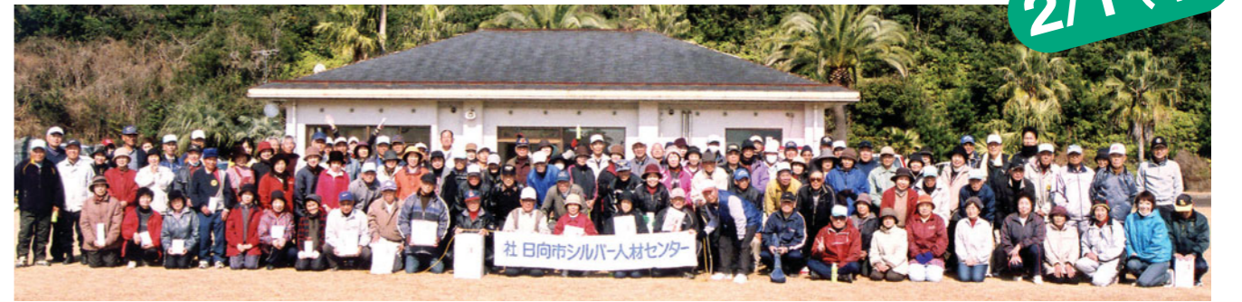
寒さに負けず全員集合