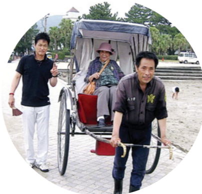
人力車の乗り心地