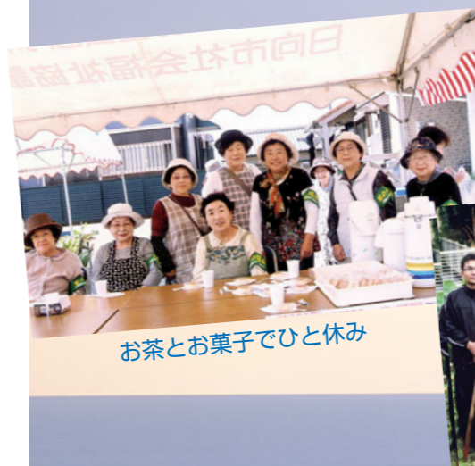
お茶とお菓子でひと休み