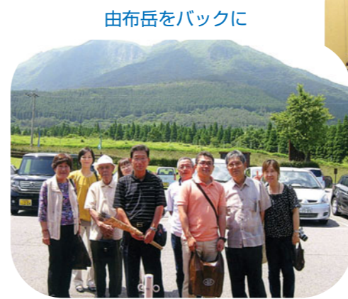
由布岳をバックに