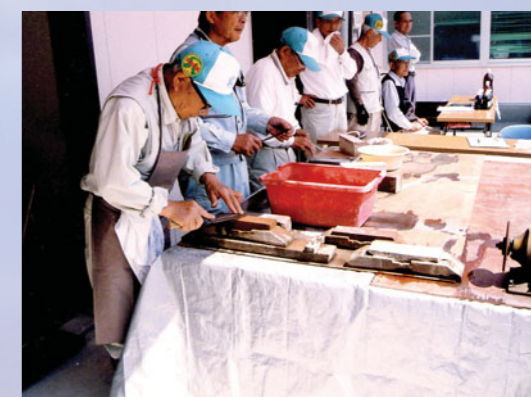
初めての刃物研ぎ 切れ味抜群