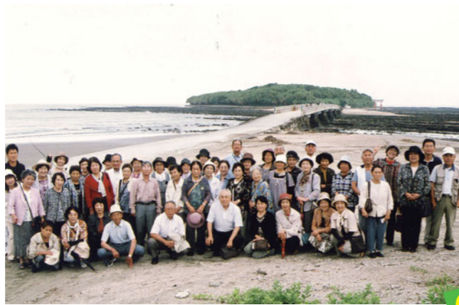
青島を背に勢ぞろい