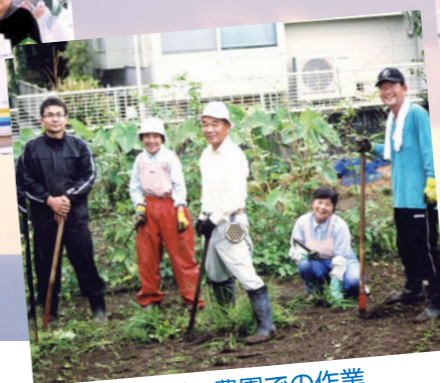
シルバー農園での作業