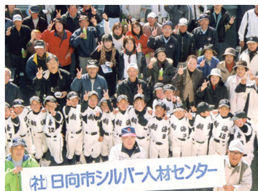
皆んなで頑張りました。

次世代を担うこの子達にあたたかく接していただいたことに感謝するとともに、この子達がいつか恩返しをする日がくると期待できたすばらしい企画であったと思います。