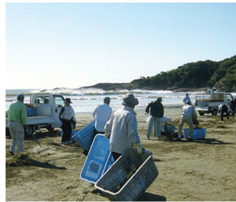
コンテナで集める