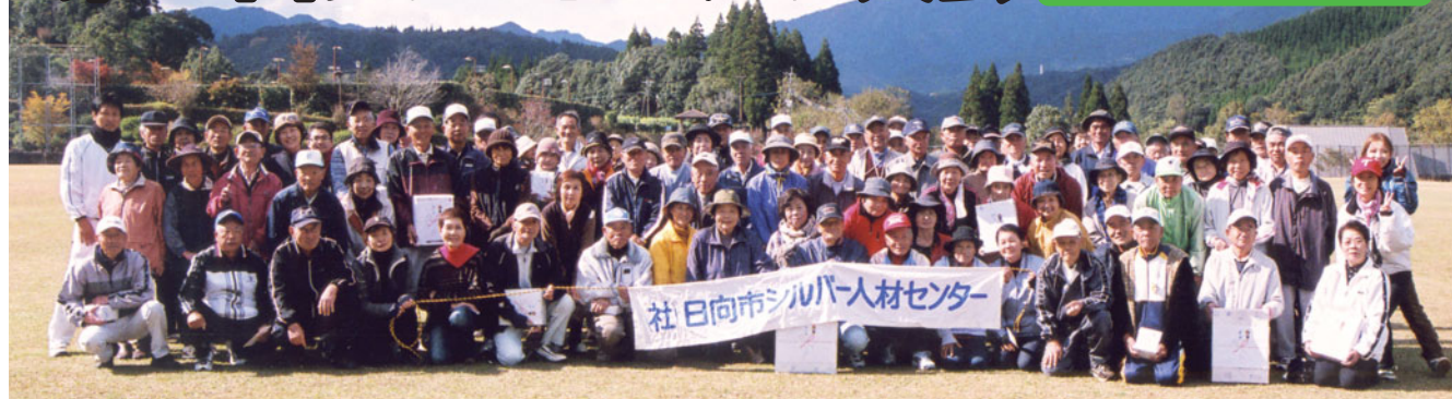
青空の下 全員集合

十一月十四日牧水公園にてグランドゴルフ大会が行われました。当日は曇り空で少し肌寒い日でしたが、お陰さまで準備勝することができ大変嬉しく思っています。私達のチームはグランドゴルフは初めてと云う人が多く開始早々珍プレーが続出し和気あいあいと楽しい大会でした。人との出逢いとふれあいを大事にして健康に気をつけて頑張りたいと思います。