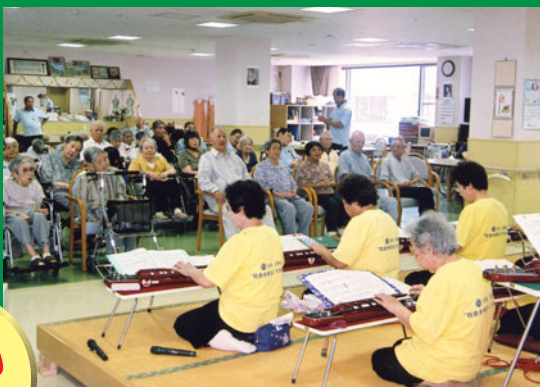
菜の花会が盛年館で大正琴を演奏