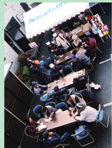
カフェコーナーの マドレーヌが評判!