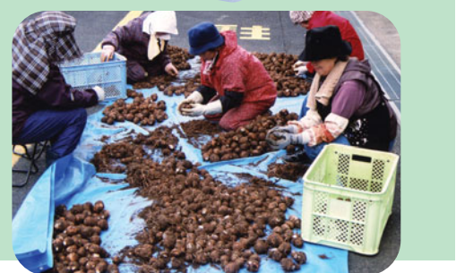
シルバー農園の作物