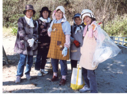
木かげでひと休み