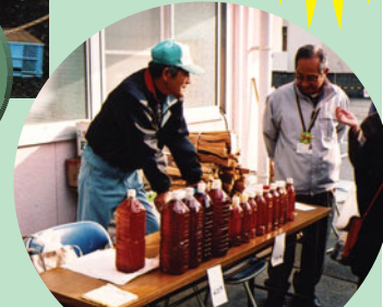
新・竹酢液・竹炭・腐葉土