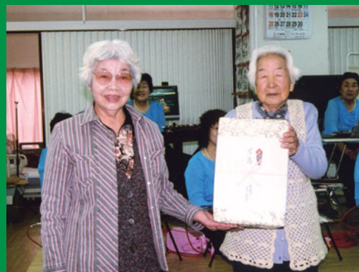
永寿園にぞうきんを寄贈