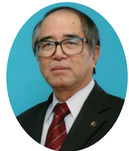
日向市長 黒木 健二

明けましておめでとうございます。皆様には健やかで清々しい新年を迎えることと心からお喜び申し上げます。昨年中は、市政推進に格別のご理解とご協力を賜わり、深く感謝申し上げます。