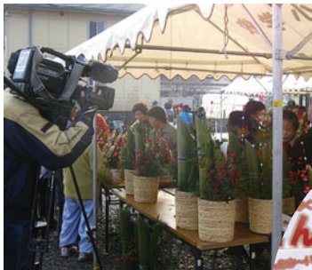
わいわいケーブル取材