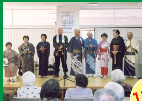
百舌の会が永寿園で美声を披露