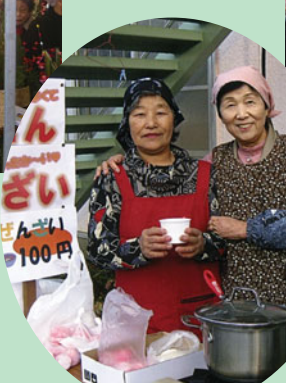
ホットなぜんざい