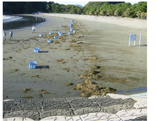
打ち上げられているゴミ

入会してやっと一年が過ぎました。入会したものであるかどうか不安でしたが、一緒に作業する方々に仕事のしかたを教わりながらどうにか勤めています。そして初めての奉仕作業。現場に行つて何をして良いのか分からずうろろろしていると同じ地域班の先輩に声をかけられて、一緒に作業をしました。久しぶりに行った伊勢ヶ浜はゴミや雑草等とても荒れていましたが、あつという間にきれいになって別天地にきたみたいでした。それにしても先輩の方々のシルバーとは思えないパワーと生き生きとした表情に、私もいっぱい元気をもらって帰ることができました。帰りにももらった弁当はとてもおいしかったです。