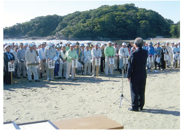
市長さんのあいさつ