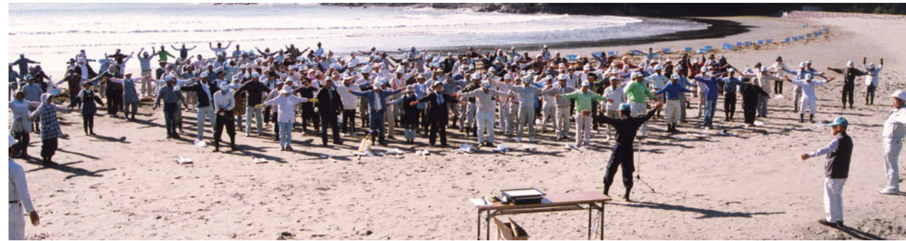
作業前にラジオ体操