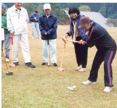
ホールインワンを狙って