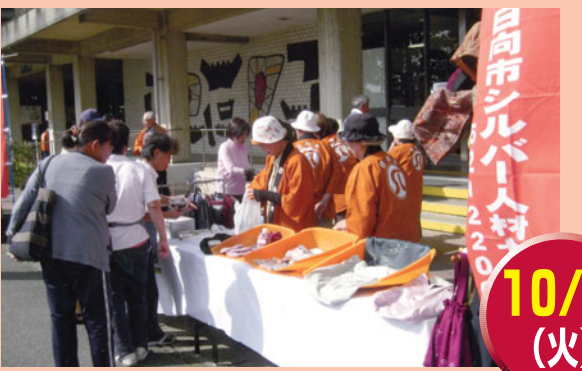
アンケート調査と小物販売でPR