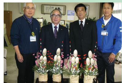
市長・副市長に寄贈し喜ばれました