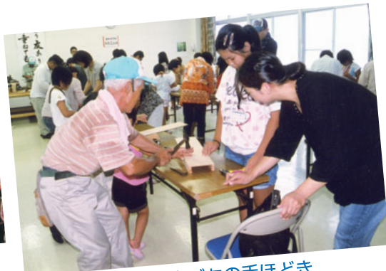
金づちの手ほどき

小学一年生から六年生までの親子総勢五十名の参加があり、夏休みの課題にぴったりの「レターラック」を作りました。この教室の先生は大工仕事をしているベテラン会員です。