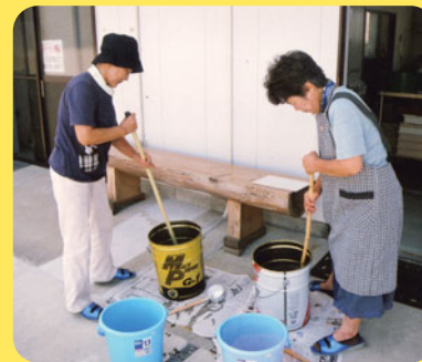
廃油で石けんを作る

と職員のチームワークがあるからだと思います。また、事務局と会員の皆さんの連携がスムーズにいつているから専門業者にも負けない仕事ができるのでしよう。