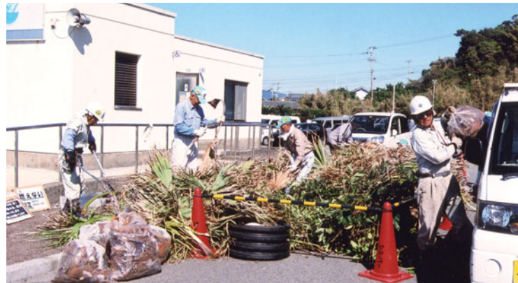
集めたゴミの仕分け

開会式でのあいさつ・体操に始まり作業に入りました。私がシルバーで一番最初に働いた人との一年四ヶ月振りの再会もありました。皆、それぞれの分野で頑張りがあります。これからは皆様と力を合わせ励んでいこうと思います。