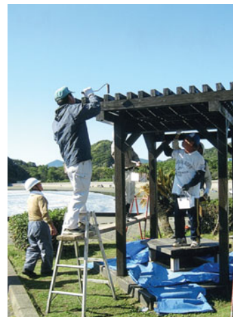
塗装もお手のもの