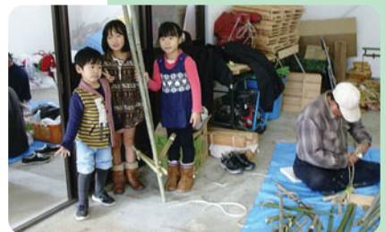
竹馬で遊ぶ子どもたち