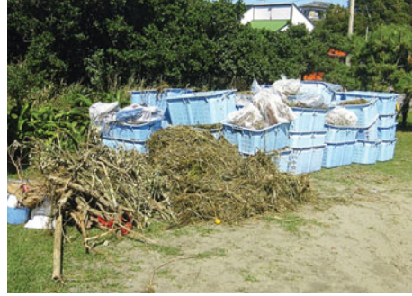
集められたゴミの山