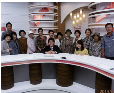
アナウンススタジオで