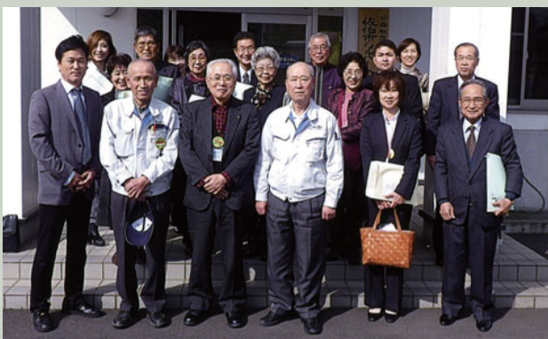
佐伯市シルバー人材センターへ