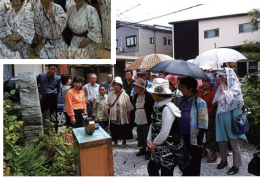
金子みすずのお墓

宴会の後、バスも結構長い時間の乗車でしたが、休憩ごとに山ほどの買い物をして疲れも見せないシルバーパワーです。またこれをエネルギーに変えて頑張るんでしょうね。お疲れ様でした。