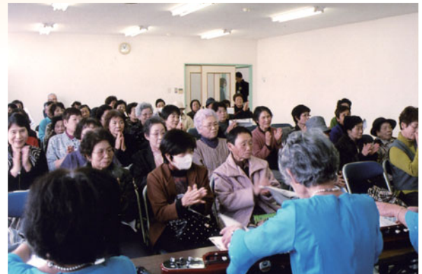
大正琴の演奏に聞き入る