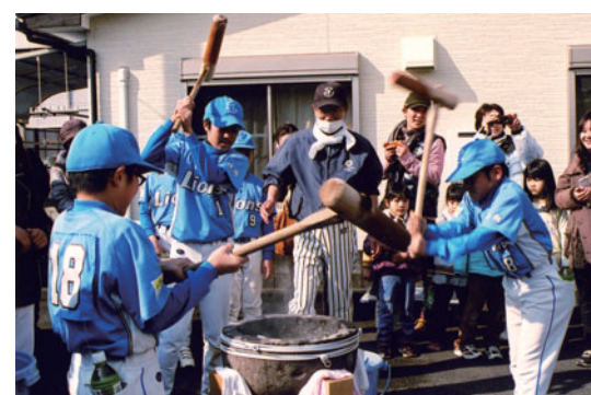
もちつきもチームワーク