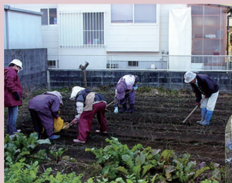
ちょっと腰がいたいです

作物等はまだまだですが、会員一同勉強し、良い野菜を作りたいと思っています。親睦を深めるため、食事会、カラオケ、忘年会等毎年行なっています。会員を募っております。ふるっての参加をお待ちしております。 農園に三月に植えたネギが今青々と育っています。 次の作物を植付けるのが楽しみです。