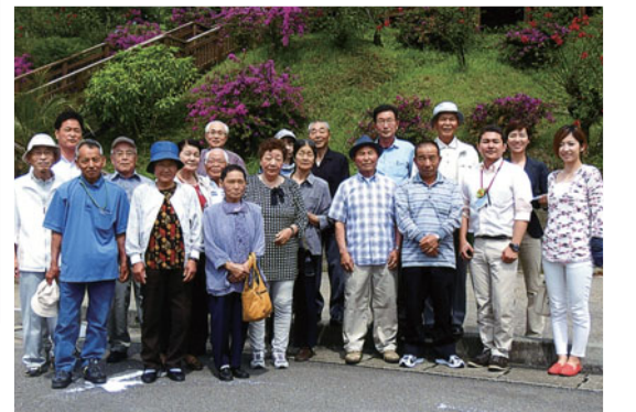
道の駅フェニックスにて