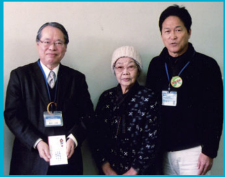
局長と尾崎会長で社協へ

会員さんから提供された日用品や、農作物、そよ風会手作りの小物、梅干し、味噌等を販売しました。今年会場が広がったので、お客さんも大勢集り、特にシルバーコーナーは人気がありPRできました。売上げ金23,270円を社会福祉協議会に寄付しました。