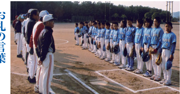
お手やわらかに「お願いしまーす。」