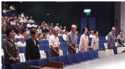
10年表彰のみなさん

皆様に支えられ今日がある。これからも、足手まといにならぬよう頑張つて行きたいと思つています。