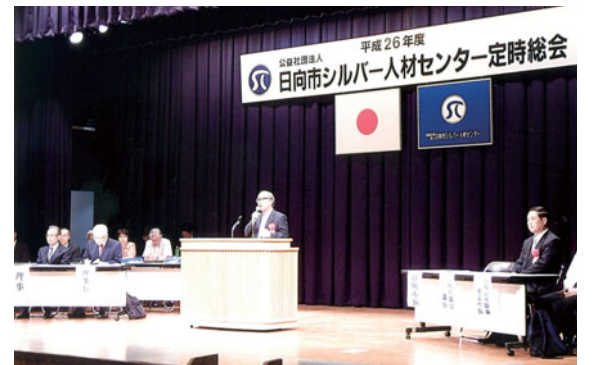
日向市長よりお祝いの言葉を頂きました