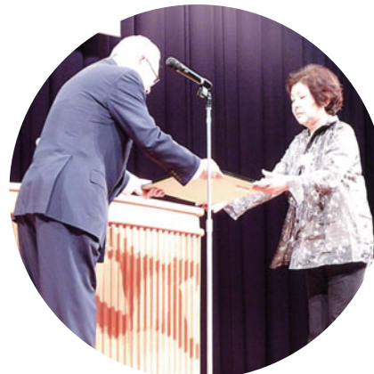
10年表彰者を代表して

入会して二十年、色々な会員さんとの出会いがあり友達もたくさんできました。手さぐりで立ちあげた「そよ風会」もすばらしいリーダーに恵まれ、今ではメンバー全員楽しく小物作りに頑張つています。これからも頂いた記念品の時計のように有意義な時を刻みたいと思います。