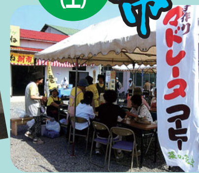
マドレーヌとコーヒーの香り