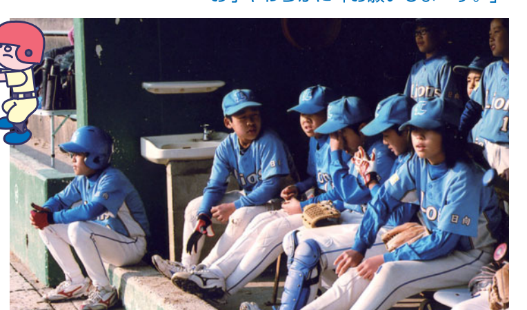
じいちゃん スゲエーツ

たかもしれないので、とても良い試合ができたと思います。6年間で、とても楽しい日になりました。中学生になっても、野球をがんばります。