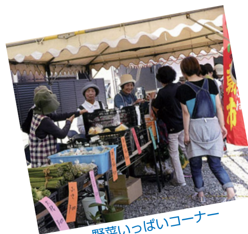
野菜いっぱいコーナー

会員十数名。週一回練習をしています。施設などの訪問要請が数多くあり、皆様に喜ばれています。女性の集いで必ず美しい音色が響きます。