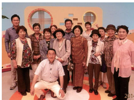
アナウンサーといっしょに