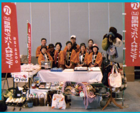
開店を待つスタッフ