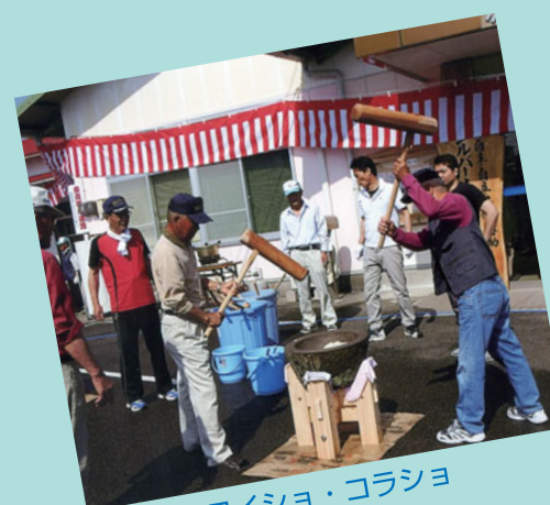
ヨイショ・コラショ