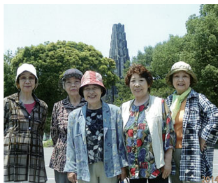
平和台をバックに