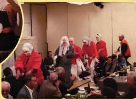
ひょっとこも登場