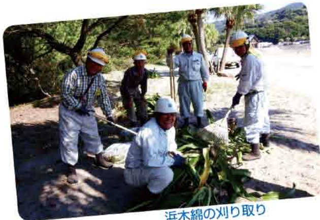
浜木綿の刈り取り

別の班では休憩所の塗料の剥げた部分を塗りなおしていましたが、それも見事に綺麗になっていくのが遠目にもわかりました。昼前には受け持ちの作業も終り、見渡すと殆どどの作業が終了しており、日向の名所であるこの伊勢ヶ浜がすっかり綺麗になって、気持ちの良い眺めとなりました。このような美化運動は少人数ではむずかしく、シルバー人材センターの動員力があればこそ出来るものだと思います。次回も又、この行事に参加したいと思います。