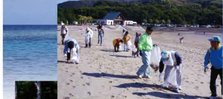
小さいゴミも残さずに