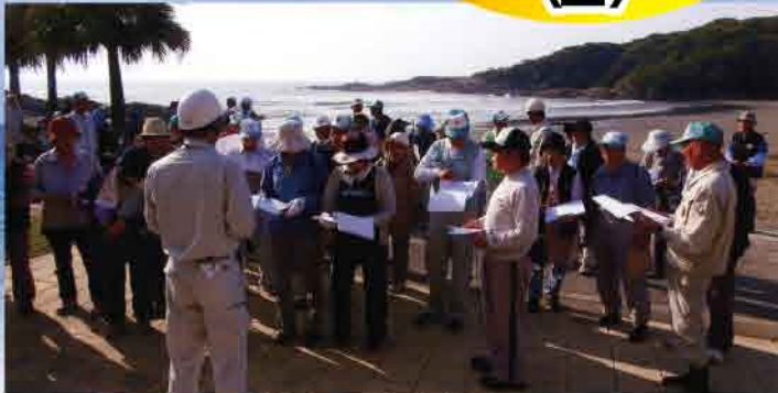
地域班の分担作業確認

終わるころになるとポリ袋はいっぱいになっていました。心地よい汗をかきやりとげたという充実感が湧いてきました。終了後、「龍宮」という洞窟に連れていってもらいました。地元にながら初めて知り感動しました。美しい日向の自然を子子孫孫まで残していくために少しでも役に立てればと思います。