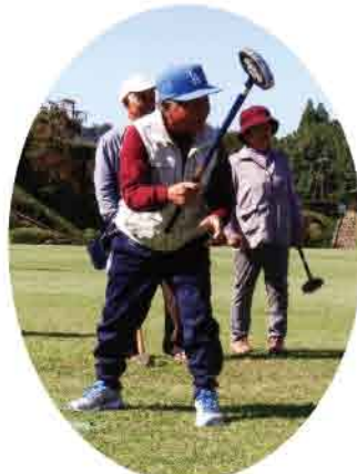
2本目のホールインワン