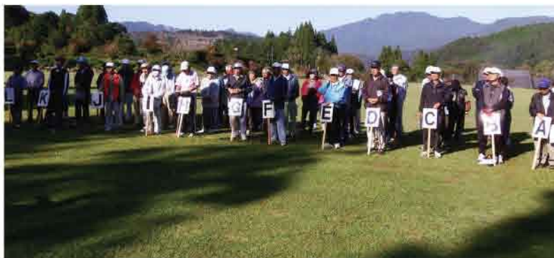
A~Lに分かれてスタート

10月28日、東郷町の牧水公園でグランドゴルフ大会に参加し、今回も記録係をしようと思っていました所、出場することになり、体調も良く芝生もきれいに刈つてあり頑張りました。