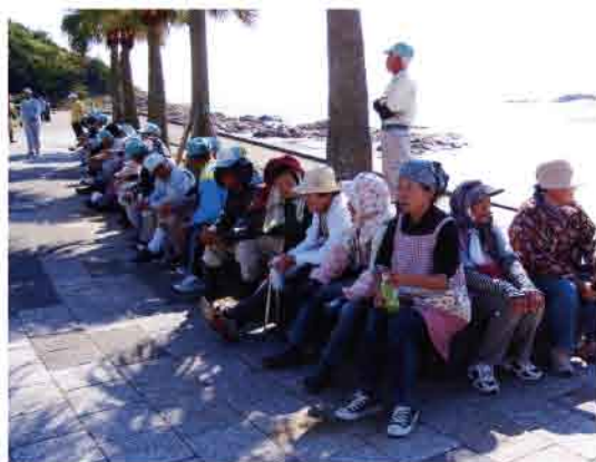
仕事を終えた喜び