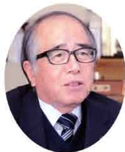
日向市長 黒木 健二