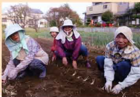
ラッキョウの植え付け