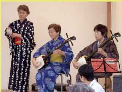
「シャンシャン馬道中」