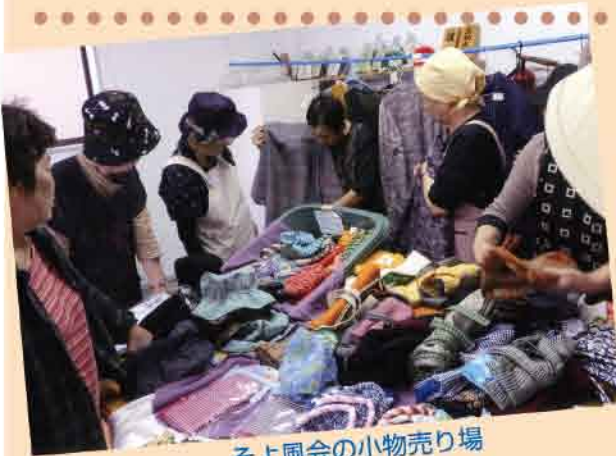
そよ風会の小物売り場

出来上がった作品を、みなこんねの店で販売したり、みなこんね朝市に出したりしています。ほとんどの作品はリフォームですが、会長の指導でも素敵に仕上がりが、喜ばれています。朝市での人気も良く、作品作りにも力が入ります。