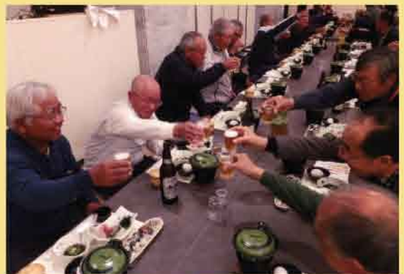
「1年間ごろうさまでした。」