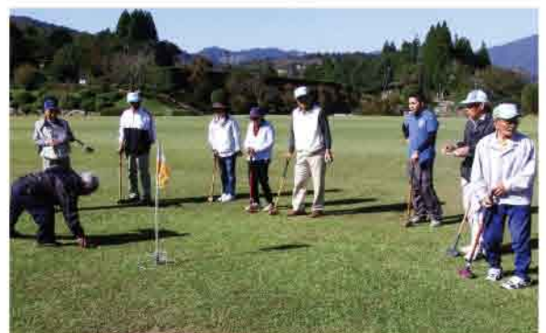
プレッシャーの中で