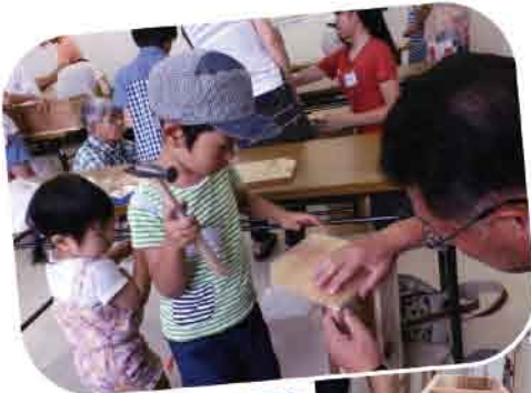
手に気をつけてネ

三回目となる今回の作品は、「ブックエンド」。早く出来上がったお子さん達は自分のお気に入りのテープを貼って飾り付け、世界に二つだけの「本立て」を仕上げていました。 終了後、嬉しそうに帰ろうとしている子供さんを引き止めながら、「毎年やってくるんですか?」「来年も来たいので連絡してください!」と言ってくくださるお母さんもいらして、こちらも大変うれしくなりました。