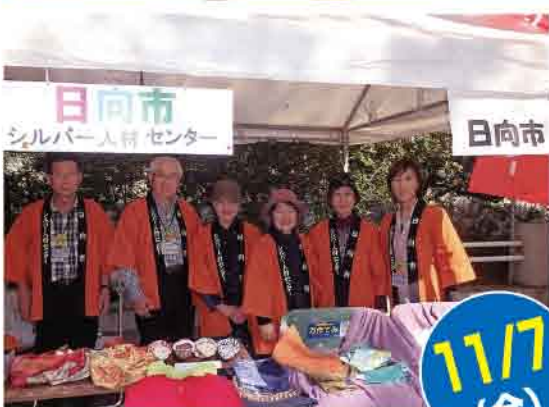
県庁前にて小物販売