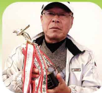
トロフィーを手に