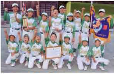
財光寺キング 優勝メンバー

第7回「世代間交流ソフトボール大 会」の対戦相手は、秋の五ヶ瀬ライオン ズクラブ旗争奪大会ほか、数々の大会 で優勝している『財光寺キング』です。