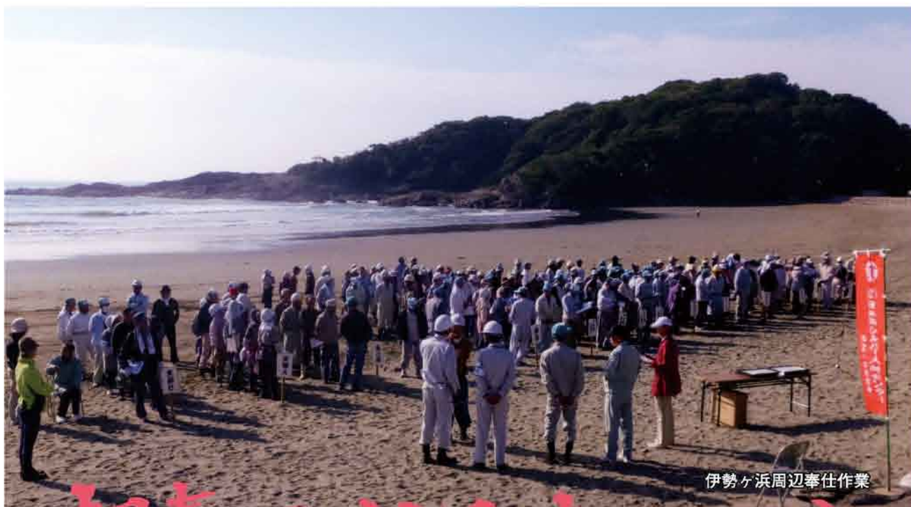
伊勢ヶ浜周辺奉仕作業

公益社団法人 日向市シルバー人材センター 〒883-0021 日向市大字財光寺847番地1 TEL (0982) 52-2200 FAX (0982) 52-3476