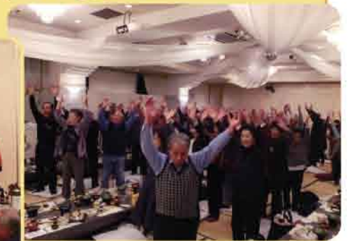
元気よくバンザ〜イ