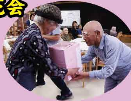
手作りそうきん奇贈