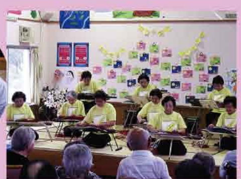
琴の音を楽しんで