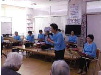
「お誕生日おめでとう」