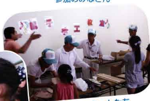
匠のじいちゃんたち