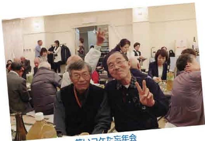
笑いコケた忘年会

せ。」と言いたいところですが、肩やら腰やら腕やらマッサージしてやっています。今は夏の疲れも出ているのかもしれない。そんなときは一杯飲んでバタン・キュー。で、今度の忘年会も大歓迎です。幹事さんは女性会員さんだと聞きました。楽しみにしています。私は飲んだらアゴがはずれるからようしゃべると思います。