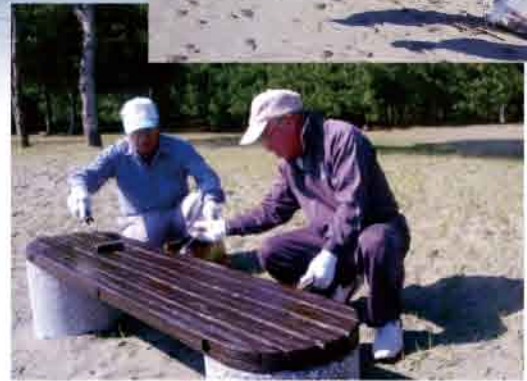
ベンチもきれいに