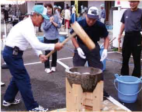
息の合った「ヨイショ」「ヨイショ」