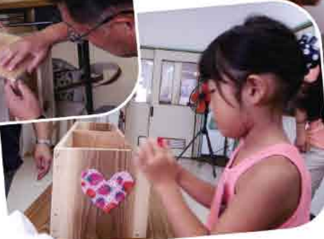
お気に入りのテープを