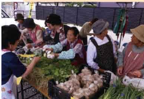
野菜売り場コーナー

畑作業の好きな会員が集まって活動しています。主な作業は、農作物の植え付けから施肥・除草・収穫まで年間通して行っています。会員は12名です。毎回都合のつく人が出て、和気あいあいと楽しく作業しています。 収穫した農作物は、年3回行われる「みなこんね朝市」にて販売し、地域の人に喜んでもらっています。