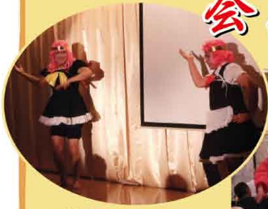
芸能人をお迎えして