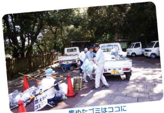
集めたゴミはココに

別の班では休憩所の塗料の剥げた部分を塗りなおしていましたが、それも見事に綺麗になっていくのが遠目にもわかりました。昼前には受け持ちの作業も終り、見渡すと殆どどの作業が終了しており、日向の名所であるこの伊勢ヶ浜がすっかり綺麗になって、気持ちの良い眺めとなりました。このような美化運動は少人数ではむずかしく、シルバー人材センターの動員力があればこそ出来るものだと思います。次回も又、この行事に参加したいと思います。