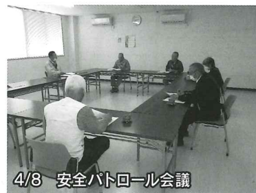
4/8 安全パトロール会議