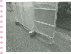
下カバー付きの防護ネット

日が暮れるのが早くなり、帰り道の車の運転が暗くなってきました。年末・年始の夕暮れ時間帯は、ドライバーからは道路を横断する歩行者や走行中の自転車が見えにくいことから、交通事故が多発するそうです。十分に気を付けましょう。早く帰り着きたくても、夕方の運転は、いつもよりちょっとゆっくり目で!