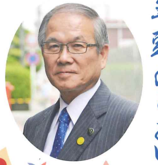
日向市長 十屋 幸平