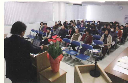
平成30年3月開催の女性の集いの様子

ほかにも福祉施設へ手づくりぞうきんを寄贈し喜ばれています(右ページをご参照ください)。